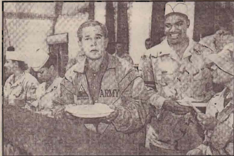
பாக்தாத்திற்கு திடீர் பயணமானதை மேற்கொண்ட அமெரிக்க சனாதிபதி புஷ் அமெரிக்கப் படை வீரர்களுடன் உணவுச்சாலையில்...

புஷ் பாக்தாத்தில் இருந்து திரும்பிய மறுதினம் நியூயோர்க் கின் சனநாயகக் கட்சி சேனட்டான கிளாதி கிளின்டன் பாக்தாத்துக்கு விஜயம் செய்து அமெரிக்கத் தூர்ப்புக்களையும் உயர் அதிகாரிகளையும் சந்தித்து உரையாடியுள்ளார்.