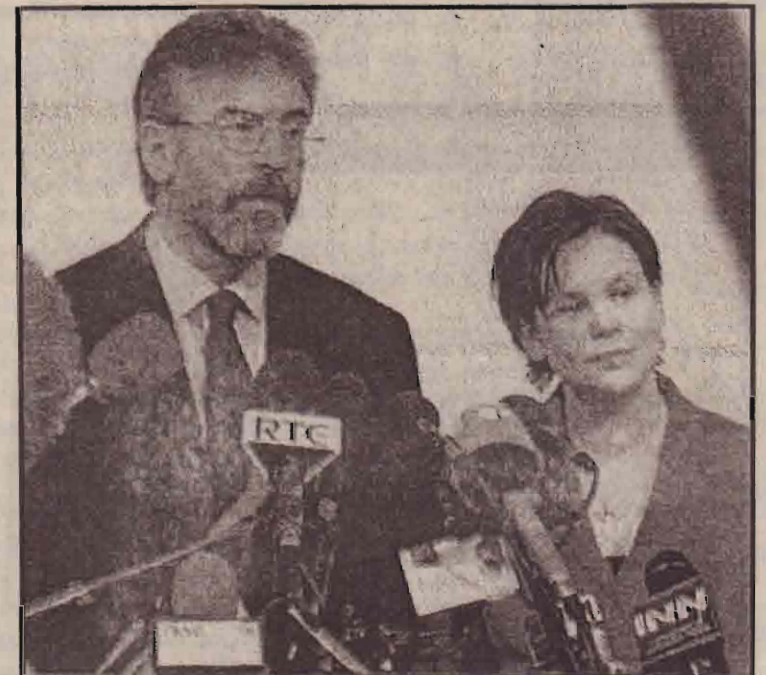
வட அயர்லாந்தின் சிம்பெய்ன் இயக்கத் தலைவர் ஜெரி அடம்ஸ் (இடது) மற்றும் அதன் உறுப்பினர் மேரி லோம்க்டொனாட் ஆகியோர் மேற்கு வெல்ஸ் பாஸ்ட் நகரில் தேர்தல் குறித்து விளக்குகின்றனர்.

எயிட்ஸ் நோய் காரணமாக மரணமடைந்துள்ளமை குறிப்பிடத்தக்கது.