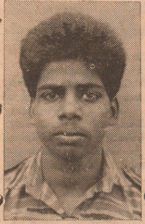
2ஆம் லெப். மணியம்

இச்சம்பவத்தில் இராணுவத்தினருக்கு ஏற்பட்ட சேத விபரம் தெரியவரவில்லை. இம் மோதலில் இரு விடுதலைப் புலிகள் போராளிகள் வீரச்சாவடைந்தனர். வீரச்சாவு (4ஆம் பக்கம் பார்க்க)