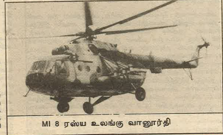
MI 8 ரஸ்ய உலங்குவானூர்தி