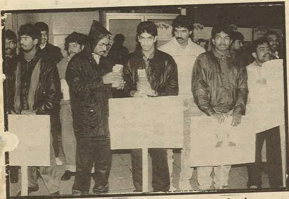
நள்ளிரவில் மெழுகுவர்த்தி போராட்டம் - இலண்டன் இந்தியத் தூதரகம் முன்பாக