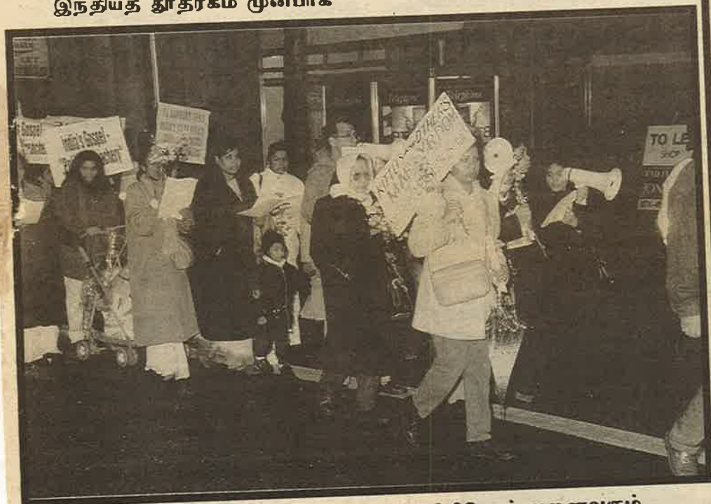
தமிழ் மகளிர் - சிறுவர்கள் - பெரியோர் - சிறியோர் அனைவரும் இலண்டன் ஊர்வலத்தில்