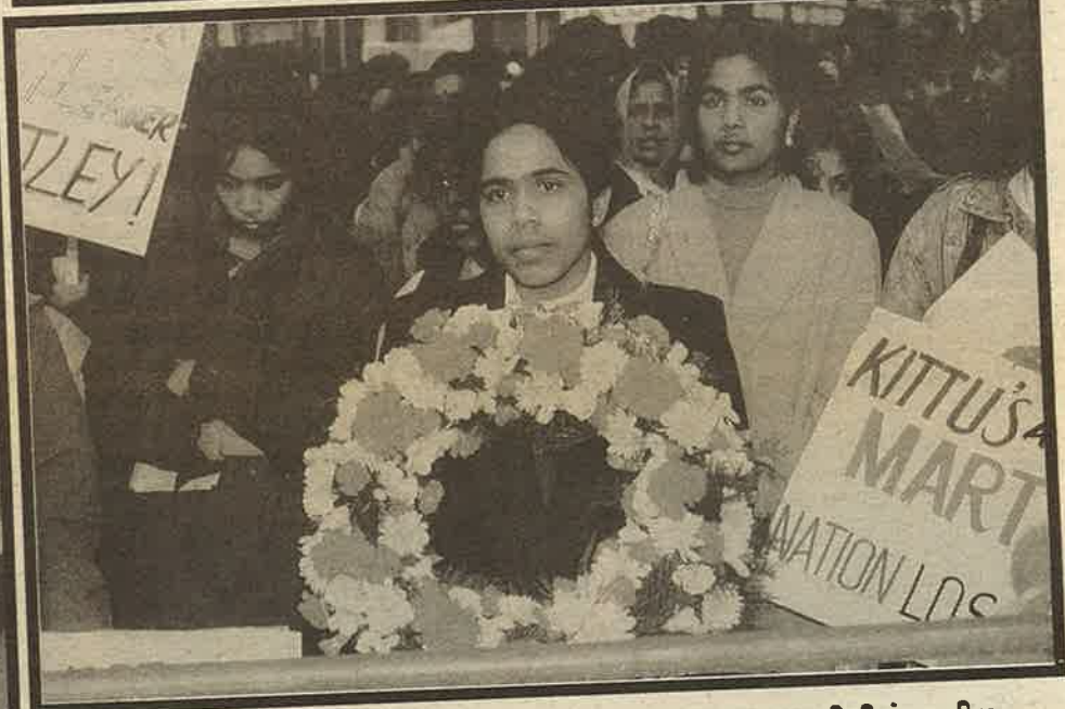
இலண்டன் இந்தியத் தூதரக நுழை வாயிலில் மறியலிட்டு கண்டனம்

நீ விட்டுச்சென்ற... உன் கனவுகள்... உன் நினைவுகள் அனைத்தும் உயிர் பெறும் ஓர் நாள்! அந்த நாள் வரை... நாம்... உன் பயணத்தைத் தொடர்வோம்!