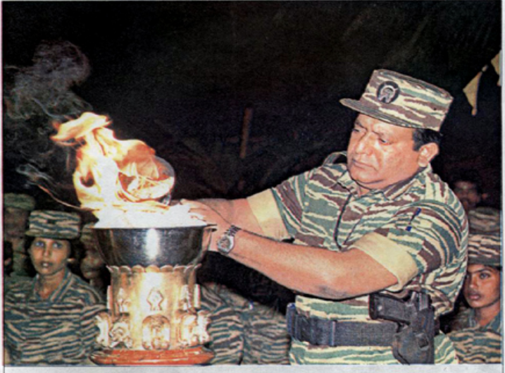
2002 மாவீரர் நாளன்று தமிழீழத் தேசியத் தலைவர் மேதகு வே. பிரபாகரன் அவர்கள் மாவீரர் நினைவாகப் பொதுச்சடரினை ஏற்றுக்கொள்ளும் போது

விபரமாக விளக்கக் கூறுவது அவசியமில்லை. இத் திட்ட வரைவு ஏற்கவே ஊடகங்கள் வாயிலாக எல்லோரும் பார்வைக்கும் ஆய்வுக்குமாக வெளியிடப்பட்டுள்ளது. எமது திட்ட யோசனைகள் பலரகமான சர்ச்சையையும் குழப்பத்தையும் கிளப்பியபோதும் சமாதானத் தீர்வை நோக்கி நாம் எடுத்த முயற்சியை உலக நாடுகள் பல வரவேற்றுள்ளன. எமது யோசனைகளை விபரமாகவும் தெளிவாகவும் முதற் தடவையாக எழுத்தில் முன்வைத்ததையும் சில வெளிநாடுகள் வரவேற்றுள்ளன. ரணிலின் அரசு எமது திட்ட வரைவை நிராகரிக்காது, அதன் அடிப்படையில் பேசுவதற்கு இணக்கம் தெரிவித்தது அதே வேளை, எமது இடைக்கால