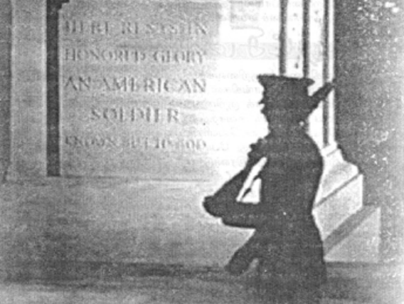
அறியப்படாத போர் வீரனின் கல்லறையொன்றைக் கட்டுதலுக்கும் ஒரு போர்வீரன்

முக்கிய வரலாற்று அடையாளங்களில் ஒன்றாக இச்சதுக்கம் இடம்பெறுகின்றது. போரில் மடிந்தோர் உடலை மண்ணில், கல்லறையில், கடலில் அடக்கம் செய்யலாம் என்பது மேற்கின் பொதுவிதி. கடலில் அடக்கம் செய்வதை BURI