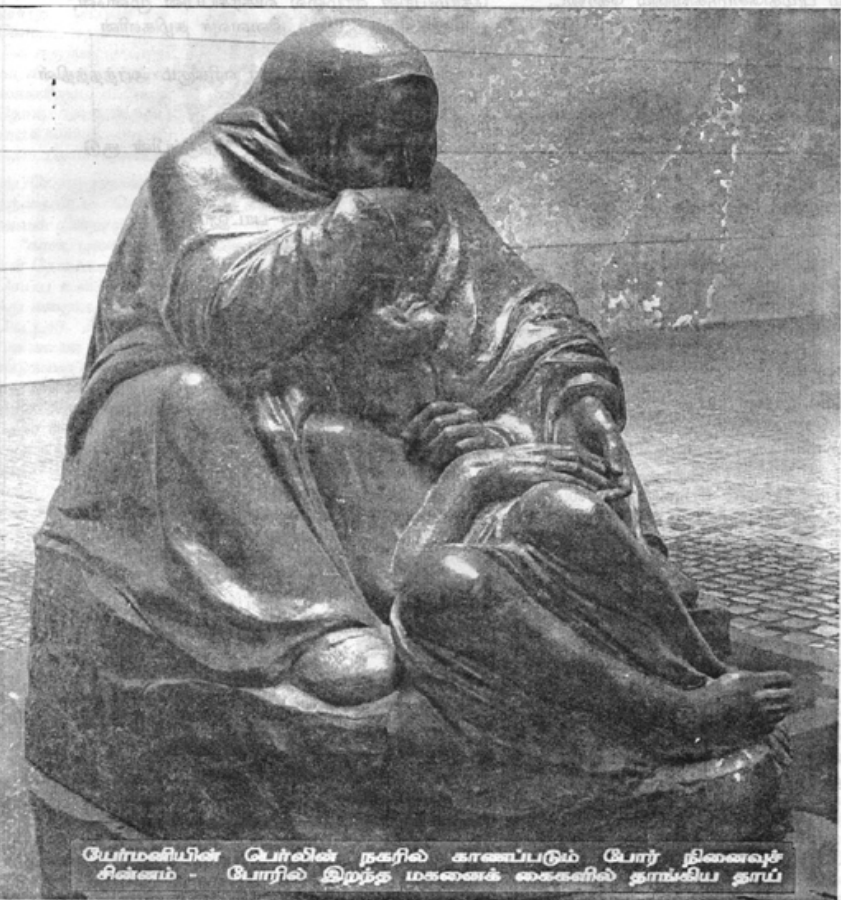
யோமனியின் பெர்லின் நகரில் காணப்படும் போர் நினைவுச் சின்னம் - போரில் இறந்த மகனைக் கைகளில் தாங்கிய தாய்

தில் அவர்கள் உறங்குகிறார்கள். இவ்வாறு கூட்டாக உறங்கும் நிலத்தை போர்வீரர் இருநிலம் என்ற அர்த்தத்தில் WAR CEMETERY என்று ஆங்கிலத்தில் அழைக்கிறார்கள். போர்வீரர் இருநிலத்திலும் பொதுமக்கள் இருநிலங்களிலும் 'கியூ' எனப்படும் ஒருவகை மரங்களை நட்புப் பராமரிப்பது மேற்குலக வழமை. உயரமாகவும் செழிப்பாகவும் வளரும் கியூ (YEW)மரம் சோகத்தின் சின்னமாகக் கருதப்படுகிறது. வளைந்து கொடுக்கும் தன்மையும், நார்ப்பிடிப்பும், எட்டையுடன் கடிய பலமுட்கொண்ட இம்மரத்தின் கிளைகள் முன்கொரு காலத்தில் அம்பும் வில்லும் செய்வதற்குப் பயன்படுத்தப்பட்டன. போரியல் வரலாற்றுடன் தொடர்புடைய கியூமரம் இன்று இருநிலத்தில் நிறுத்தப்பட்டுள்ளது. இறந்த வீரனின் வித்துடலை மீட்க இயலாது போனால், அல்லது வேற்று நாட்டில் புதை