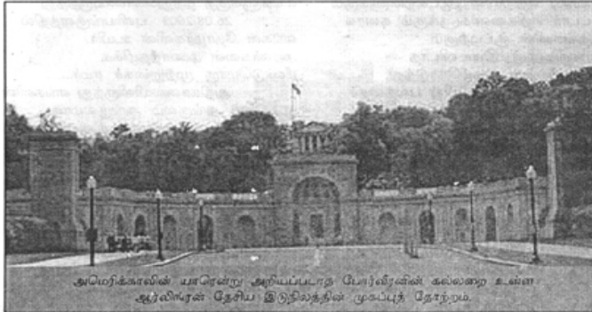
அமெரிக்காவின் யாடென்று அறியப்படாத போர்வீரனின் கல்லறை உள்ள ஆர்லிங்டன் தேசிய இடுதிவந்தின் முகப்புத் தோற்றம்.

பாலும் மறைந்துவிட்டது எனலாம். கடலோடு தொடர்புடைய படையினர் தாம் இறந்தபின் தமது உடலைக்கடலில் அடக்கம் செய்யும்படி சாதனம் எழுதுவர் அல்லது சுற்றத்தாருக்குப் பணிப்பர். இது இன்னுமோர் பாரம்பரியம்.