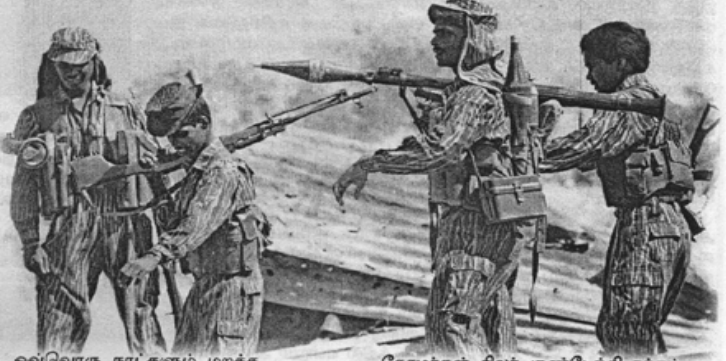
ஒவ்வொரு நாட்களும் மறக்க முடியாதவை.

ஒன்றன்பின் ஒன்றாக தங்கள் கவசங்கள் அழிந்துகொண்டிருந்ததால்