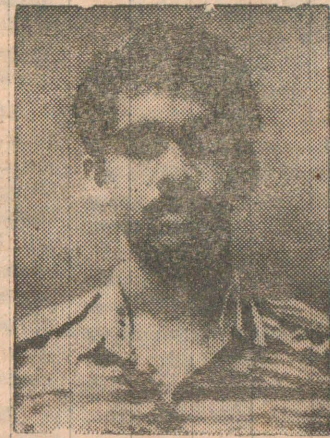
வீரவேங்கை நிலவன் (சிலோச்சன்)