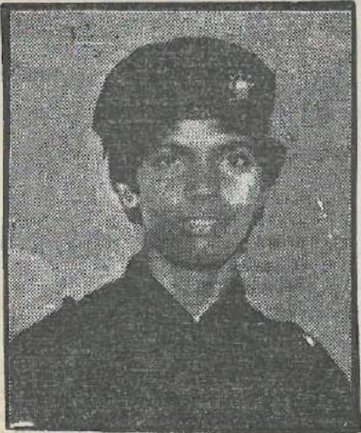
கடற்கரும்புலி கப்டன் இளமதி

தலைவர் வளர்த்துவிட்ட பனோவுறுதியையே துடுப்பாக்கிக் கொண்டு எளமிருங்கினர் கடற்புலிகள்.