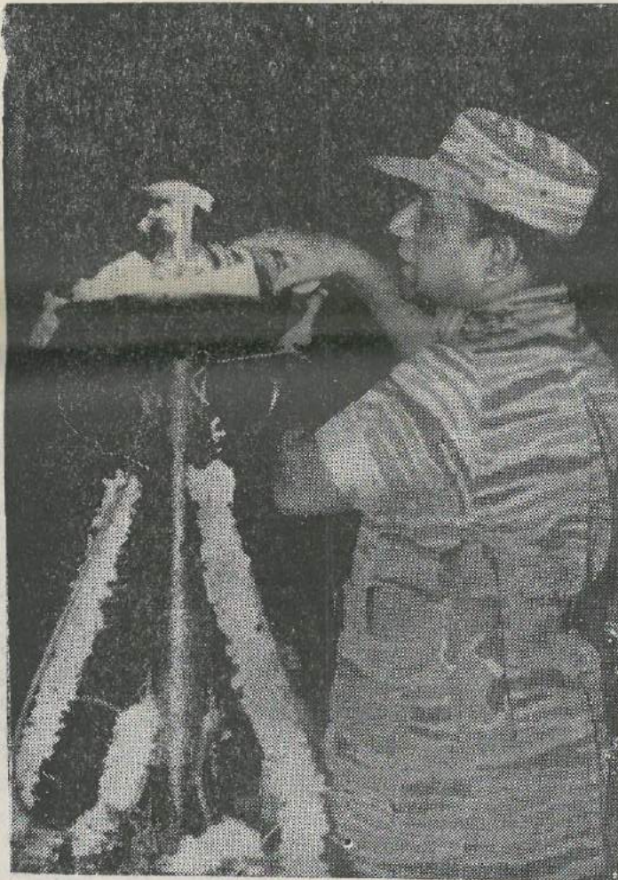
நாள் திரும்பி வரவில்லை. வேவுப் பிரிவு ஆரம்பித்த காலம்