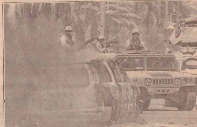
பாக்தாத்தில் விமான நிலையத்துக்கு செல்லும் பாதையில் நடத்தப்பட்ட குண்டு வெடிப்பு அடுத்து அங்கு தீப்பற்றி எரியும் வாகனம்.

தாக்குதல் நடத்தியுள்ளனர் என்று கூறப்படுகின்றது. இதனால் தான் மசூதியை இலக்கு வைத்து ரொக்கட தாக்குதல் நடத்தப்பட்டுள்ளது. வெடி பொருட்கள் வெடித்து சிதறியுள்ளன. இதன்போது பாதையில் நடந்து சென்று கொண்டிருந்த பொதுமக்கள் இருவரே பரிதாபமாக உயிரிழந்துள்ளனர்.