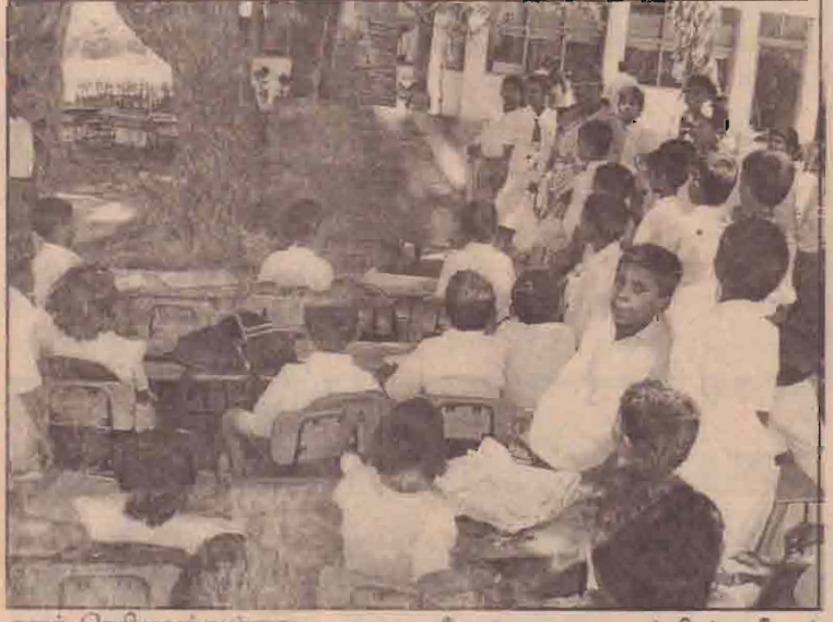
எனத் தெரியவந்துள்ளது. ஆரம்பப் பாடசாலை அமர்ந்தே கல்விகற்க வேண்டிய

அவல நிலைக்குள்ளாகியுள்ளனர். மற்றும் இப்பாடசாலை அதிபருக்கென ஒரு காரியாலயமோ மற்றும் விஞ்ஞான ஆய்வு கூட வசதியோ நூல்நிலையமோ அற்ற நிலையில் வகுப்பறைகளில் வைத்தே பாடசாலை அதிபர் தனது அலுவலக கடமைகளையும் விஞ்ஞான ஆசிரியர் வகுப்பறைகளில் இருந்தே விஞ்ஞான ஆய்வு கூட செயற்பாட்டு கற்பித்தலையும் மேற்கொண்டு வருகின்றனர்.