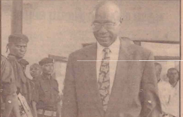
பல பணமோசடிகளிலும் வன்செயற்சம்பலங்களிலும் ஈடுபட்ட குற்றத்தால் 15 வருட சிறைத்தண்டனை விதிக்கப்பட்டு தற்போது விடுதலை பெற்றுச் செல்லும் ருவாண்டா சனாதிபதி.

அதனால் தான் இந்நாடுகளிலிருந்து வருவோரை கூடியபாகம் தடுப்புத்தரகாக இத்தகைய இறுக்கமான சட்டநடைமுறைகளைப் பின்பற்ற தீர்மானம் எடுத்துள்ளது என்று கூறப்படுகின்றது.