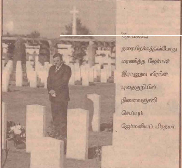
தரையிறக்கத்தின்போது மரணித்த ஜேர்மன் இராணுவ வீரரின் புதைகுழியில் நினைவஞ்சலி செய்யும் ஜேர்மனியப் பிரதமர்.

வலைப்பின்னலைப் பாதிக்கக் கூடும் என்ற அறிகைகள் வெளியான தன் பின்னர் குடிவரவு உல்லாசப் பயணத்துறை சார்ந்த கட்டுப்பாடுகளை அதிகரிக்குமாறு ஆளும் கட்சியின் தரப்பில் இருந்து ஆலோசனை கூறப்பட்டதையடுத்தே சட்டவிரோதமாக ஐப்பானில் தங்கியிருக்கும் தொழிலாளர்களை கைது செய்ய ஐப்பானிய அரசு நடவடிக்கை எடுத்துள்ளதாகத் தெரிவிக்கப்படுகிறது.