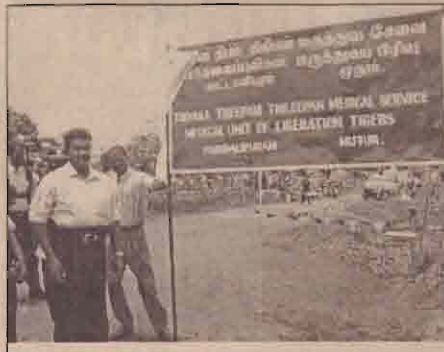
பாட்டாளிபுரத்தில் திலீபன் மருத்துவமனை

திருகோணமலை மாவட்டத்தின் இராணுவக்கட்டுப்பாடற்ற பிரதேசமான முதுர் பாட்டாளிபுரத்தில் திலீபன் மருத்துவமனை திறந்து வைக்கப்பட்டது.