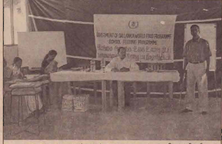
பாடசாலை மாணவர்களுக்கான உணவுட்டல் நிகழ்ச்சித்திட்டப் பிரதேச மட்டப்பயிற்சிப்பட்டறை நிகழ்வு நேற்று முன்தினம் முரசுமோட்டை முருகானந்தா மகாவித்தியாலயத்தில் நடைபெற்றபோது