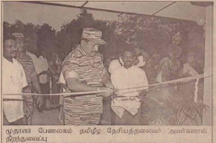
மூதாளர் பேணலகம் தமிழீழ தேசியத்தலைவர் அவர்களால் திறந்துவைப்பு

அன்புச் சோலை மூதாளர் பேணலகத்தில் புதிதாக உருவாக்கப்பட்ட தங்ககத்தை தமிழீழ தேசியத் தலைவர் அவர்கள் திறந்து வைத்து மூதாளர்களுக்கு அன்புப் பரிசில்களையும் வழங்கினார்.