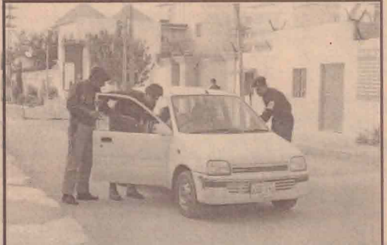
பாகிஸ்தான் கியூற்றா நகரிலுள்ள வெளிநாட்டு உதவி வழங்கும் காரியாலயத்தில் குண்டு வைக்க எத்தனித்த அல் ஹைதா சந்தேகநபர் ஒருவர் தலை மறைவாகியதையடுத்து வாசலில் உள்ள சோதனையிடும் பாகிஸ்தான் பொலிசார்.

தென்கொரியாவில் நிலைகொண்டுள்ள அமெரிக்கப் படையினரில் ஒருதொகுதியான 3500 படையினர் அங்கிருந்து அண்மையில் ஈராக்கிற்கு அனுப்பிவைக்கப்பட்டமை தெரிந்ததே.