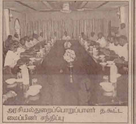
அரசியல்துறைப்பொறுப்பாளர் த.கூட்டமைப்பினர் சந்திப்பு

அரசியல் துறைப்பொறுப்பாளரும் கூட்டமைப்பினரும் சந்தித்து தற்போதைய அரசியல் நிலைமை குறித்தும் ஏற்பட்டு வருகின்ற மாற்றங்கள் குறித்தும் கலந்துரையாடினர்.