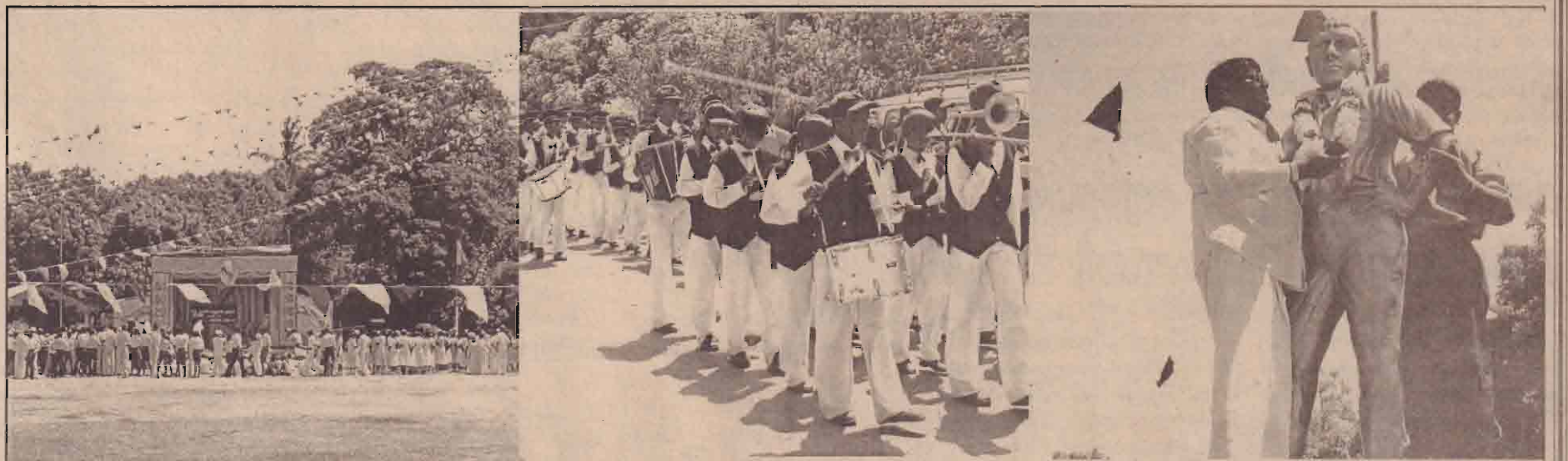
திருகோணமலையில் நடைபெற்ற மாணவர் எழுச்சிநாள் நிகழ்வையும் யாழ்.இல், நடைபெற்ற நிகழ்வில் தியாகி பொன்.சிவகுமாரனின் சிலைக்கு அவரது சகோதரன் மலர்மாலை அணிவிப்பதையும் நடைபெற்ற எழுச்சி ஊர்வலத்தையும் மேல் உள்ள படங்களில் காணலாம்.

தமிழீழமேற்கும் மாணவர் உரிமைக் குரல் ஒங்கி ஒங்கும் வகையில் மானவா எழுச்சி நாள் நிகழ்வுகள் இடம் பெற்றன.