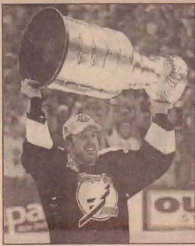
நேற்று முன்தினம் ரம்பாவில் நடைபெற்ற கென்சொம்த் ரொப்பிஸ்ரான்லி கிண்ணத்திற்கான இறுதியாட்டத்தில் வென்ற பிராட்ரிச்சர் தனது வெற்றிக் கிண்ணத்தை உயர்த்திக் காட்டுகிறார்.