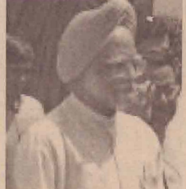
(புதுடில்லி) தமிழ்நாட்டிற்கு தேவையான