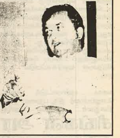
நிறைவேற்றப்பட்ட மையானது, ஐ. தே. கவிற்குள் இன்றுள்ள முரண்பாட்டிற்கு சிறப்பானதொரு உதாரணமாகும்.

ஐ. தே. கட்சிக்குள் மத்திய மாகாணத்தில் உள்ள முரண்பாட்டின் வெளிப்பாடே, ஐ. தே. கட்சியைச் சேர்ந்த நுவரேலியா நகரபிதா பதவியிலக வேண்டும் என, மத்திய மாகாணசபையில் எதிர்க்கட்சிகள் கொண்டுவந்த பிரேரணை வெற்றி பெற்றுள்ளமையாகும். இரகசிய வாக்கெடுப்பு மூலம் இத்தீர்மானம்