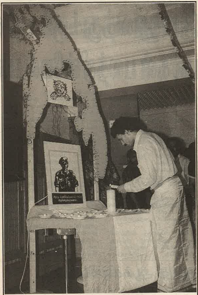
03-07-94 அன்று சனிசில் இடம்பெற்ற கரும்புலிகள் ஞாபகார்த்த எழுச்சி விழாவின் போது

வருகை தந்திருந்தோர், உணர்ச்சிப்பெருக்குடனும், விடுதலை வேட்கையுடனும், "மனிதநேயம் காப்பாற்றி வளர்க்கப்படவேண்டிய ஒன்று" என்றும், "அந்த பணியைச் செய்யவே கரும்புலிகள் உயிர் ஈந்தார்கள்" என்றும் பேசியபடியே, விழா மண்டபத்தை விட்டு அகன்றனர். ■