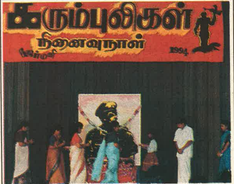
யோர்மனியில் நடைபெற்ற கரும்புலிகள் நினைவுநாளின் போது...

நோர்வேயில் போ(F)ர்ட் என்னுமிடத்தில் நடைபெற்ற சர்வதேச கலைநிகழ்வு ஒன்றில், ஈழத்தமிழ் மக்களைப் பிரதிநிதி