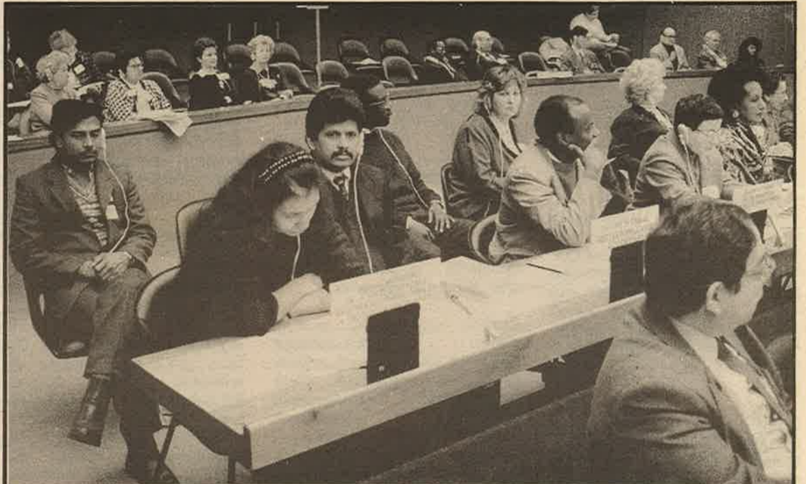
தற்போது ஜெனீவாவில் நடைபெறும் ஐ.நா. மனித உரிமைகள் தொடர்பான 49 வது மாநாட்டில் "இலங்கைத் தமிழர்" பிரச்சினையை எடுத்துரைக்கும் பிரதிநிதிகள்.

"நிர்வாகத் தேவைகளை முன்னிட்டே வடக்கு, கிழக்கு மாகாணங்கள் வகுக்கப்பட்டிருந்தன. இன அடிப்படையில்லை" என்று