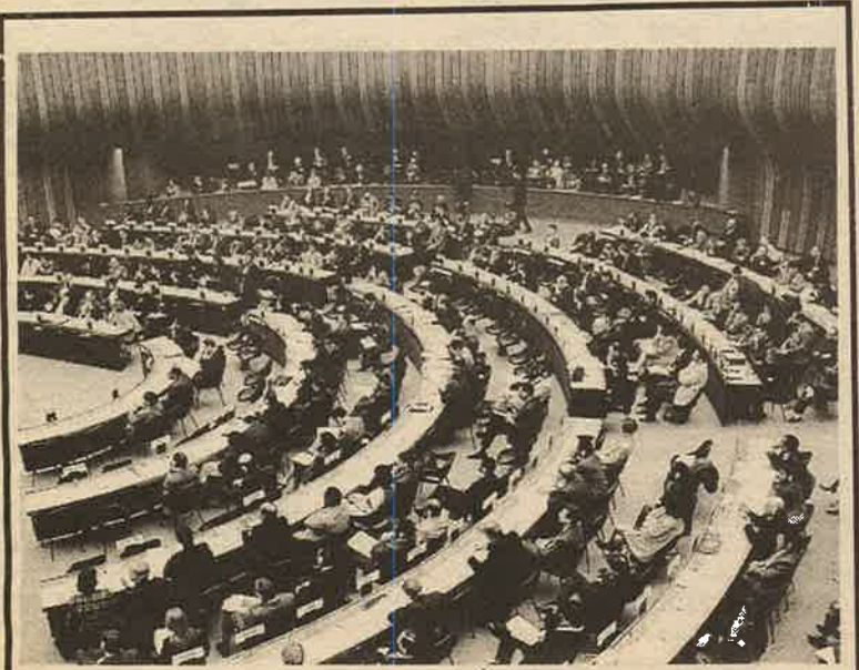
ஐ.நா மனித உரிமைகள் மாநாட்டில் ஒரு பகுதியினர்