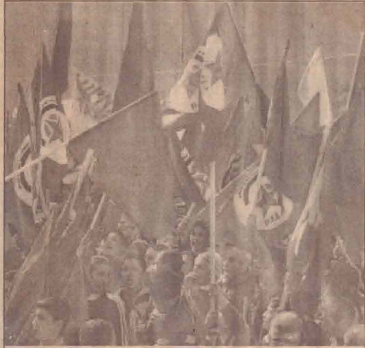
மேற்கக்கரை நகரில் இஸ்ரேல் பாதுகாப்புச் சுவரை உருவாக்கி வருவதை எதிர்த்து ஆர்ப்பாட்டம் செய்யும் பலஸ்தீனர்கள்

நெதர்லாந்தின் ஹேக் நகரில் குறித்த வழக்கு நேற்று முன்தினம் அமைந்துள்ள சர்வதேச நீதிமன்றத்தில் தொடரப்பட்ட மேற்படி இஸ்ரேலிய பாதுகாப்புச் சுவர் விசாரணைக்கு எடுத்துக் கொள்ளப்பட்டது. இந்த விசாரணை இன்று முன்றாவது நாளாகத் தொடரவுள்ளது.