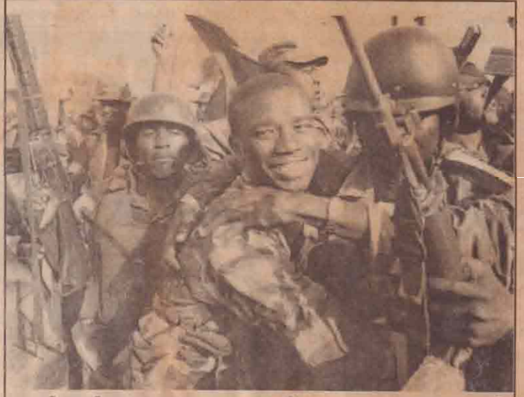
கெயி்டியில் இரண்டாவது பெரிய நகரத்தை கைப்பற்றி கட்டுப்பாட்டில் வைத்திருக்கும் கெயி்டிய தேசிய புரட்சி முன்னணியின் தளபதி ஏனைய வீரர்களைப் பாராட்டுகிறார்.

50 இலட்சம் மக்கள் வாழும் கெயி்டியை முழு வதுமாக கிளர்ச்சியாளர் கைப்பற்றி விட அனுமதிக்க முடியாது என ஐரோப்பிய நாடுகள் தெரிவித்துள்ளன. இந்நிலையில் தலைநகரைக் கைப்பற்றுவோம் என்ற எச்சரிக்கையை கிளர்ச்சிக்குழுவின் தலைவர் விடுத்துள்ளமை குறிப்பிடத்தக்கது.