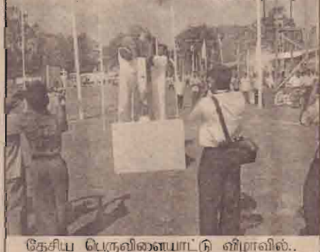
தேசிய பெருவிளையாட்டு விழாவில்..

20. * தமிழீழ விடுதலைப் புலிகளின் அதிவேக உந்துருளி சிறப்பு அணியின் பயிற்சி நிறைவில் தேசியத் தலைவர் கலந்துகொண்டு சிறப்பித்ததுடன் சாகச நிகழ்வுகளையும் பார்வையிட்டார்.