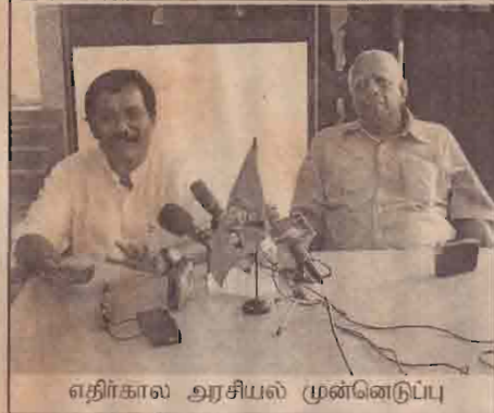
எதிர்கால அரசியல் முன்னெடுப்பு

வர்களும் மற்றும் கட்சிச் செயலாளர்களும் சந்தித்து விடுதலைப் புலிகளின் தலைமைப் பீடத்தின் கரிசனைகள் சம்பந்தமாகவும் தமிழ் மக்களின் எதிர்கால அரசியல் முன்னெடுப்புக்கள் சம்பந்தமாகவும் கலந்துரையாடினர்.