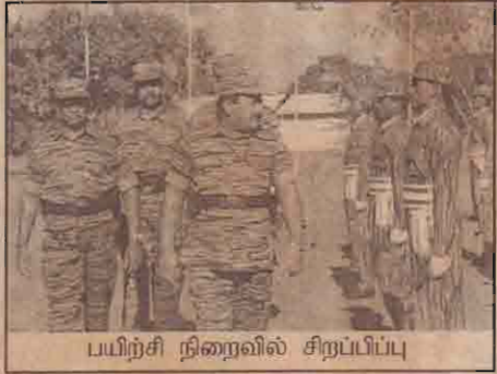
பயிற்சி நிறைவில் சிறப்பிப்பு