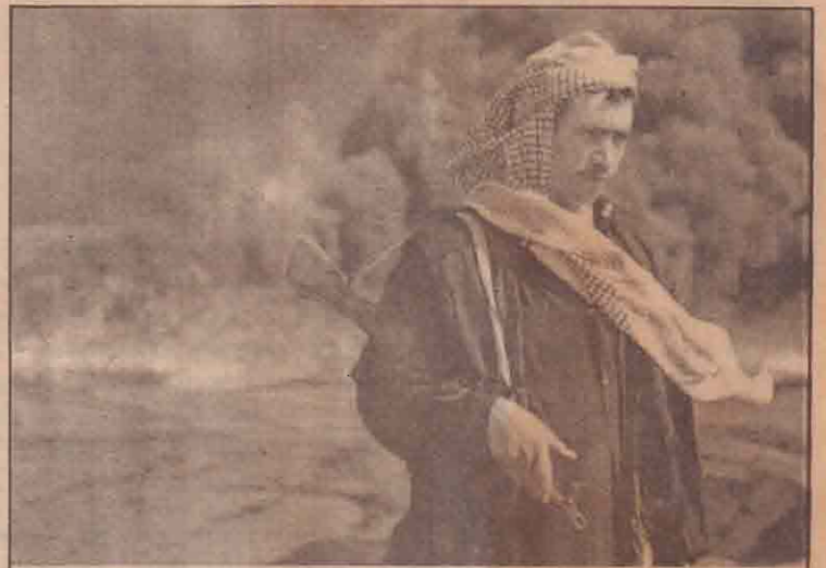
யாத்தாத்துக்கு 110 கி.மீ. தொலைவிட உள்ள கர்மலாவுக்கு அண்மையில் எரிந்து கொண்டிருக்கும் எண்ணெய்க் குளையருகில் காவல் கடமையில் ஈடுபடும் ஈராக்கிய பொலிஸார்

சென்றதேர்தல் தொடர்பான அதிகாரிகள் குழு ஒன்று இவ் அறிக்கையை வெளியிட்டுள்ளமை குறிப்பிடத் தக்கது. அனானின் ஆலோசகர் இக்குழுவிற்கு தலைமை வகிக்கின்றமை குறிப்பிடத்தக்கது.