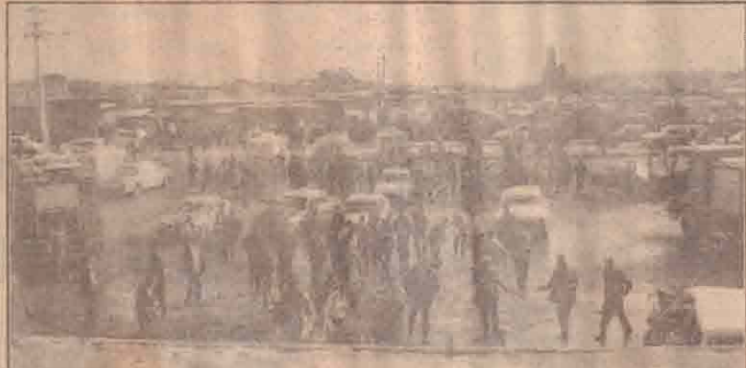
நேற்று முன்தினம் ஈராக்கில் ஹிர்க்குக் நகரில் பொலிஸ் நிலையத்தில் நடந்த கார் குண்டுத் தாக்குதலையடுத்து அங்கு கூடியுள்ள பொலிஸாரும் மருத்துவப்பிரிவினரும்.

ஈராக்கின் ஹிர்க்குக் நகரிலுள்ள பொலிஸ் நிலையமொன்றின் மீது நேற்று நடத்தப்பட்ட பாரிய கார் குண்டுத் தாக்குதலில் 10 பேர் பலியாகினர். நூற்பதுக்கும் அதிகமானோர் காயமடைந்தனர். கடமை நேரம் மாற்றத்தின் போதே இந்தக் கார் குண்டுத் தாக்குதல் நடைபெற்றதாகவும் அவ்வேளை பொலிஸ் அதிகாரிகள் பலர் அங்கு பிரசன்னமாகியிருந்ததும் கூறப்படுகிறது. ஹிர்க்குக் நகர்ப் பகுதியில் அமெரிக்க மற்றும் உள் அத்தரவினை படையினர் அடிக்கடி தாக்குதல்களுக்கானி வருகின்றமை குறிப்பிடத் தக்கது.