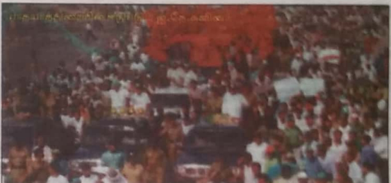
பாதயாத்திரைகளில் சந்திரிகா குமாரதுங்கவும் கலந்துகொண்டார்.

இவர்கள் கூறும் வெற்றியு காரணம் காலம் உண்மை இருந்தாலும்கூட இவ்வளவு விலைவாசியும் ஐக்கிய தேசியக் கட்சி ஆட்சிக்காலத்திற்கும் காணப்பட்ட நிலையே இக் காரணங்களுக்காகமே மக்கள் ஐக்கிய தேசியக் கட்சியை 17 ஆண்டுகளாக