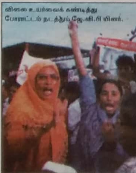
விலை உயர்வைக் கண்டித்து போராட்டம் நடத்தும் ஜே.வி.பி. மினர்.

இந்த மகஜருக்கு 'நிலை வளர்ச்சி' அரசாங்கம் விலைவாசியைக் குறைக்க விடும் தொழிற்சங்கப் போராட்டத்தை நடத்தப்போவதாக ஜே.வி.பி. அறிவித்திருக்கின்றது. இந்தப் போராட்டம் வெற்றி கரமாக நடத்துவதும் அரசாங்கம் அதனை