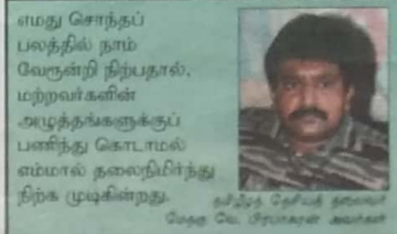
எழு சொந்தப் பலத்தில் நாம் வேறுநறி நிற்பதால், மற்றவர்களின் அழுத்தங்களுக்குப் பளிந்து கொடாமல் எம்மால் தலைநிமித்து நிற்க முடிகின்றது.