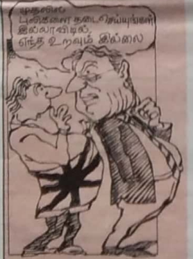
எழுதலில் பளிச்சென்று தடை விடப்படுவாள் இவ்வாறில், எந்த உறவும் இல்லை!