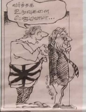
விர்த்தக உருவகளை பேணுவோமா...

நீதிக்கும் அநீதிக்கும் இடையே நடைபெற்ற பரபரப்பான இராஜதந்திரப்பீடும் ஒன்றை, பாரபட்சமான முறையில் பிரித்தானிய அரசு முடிவிற்குக் கொண்டுவந்திருக்கின்றது. சிங்களத்தின் வலியுறுத்தல் ஒருபுறமும், தமிழ்தீவிரத்தின் ஒருமித்த கோரிக்கைக்குரல் ஒருபக்கமுமாக இரண்டு தேசிய நலன்கள் சர்வதேசத் தளத்தில் மோதிக்கொண்டன. தமிழ்மக்களின் விடுதலைக்கெதிரான கூட்டுச்சக்திகளின், அழுத்தங்களுக்கு அடிபணிந்து பிரித்தானிய அரசு இறுதியில், விடுதலைப் புலிகளை பயங்கரவாத அமைப்புக்களின் பட்டியலில் இடுவதாக அறிவித்திருக்கின்றது.