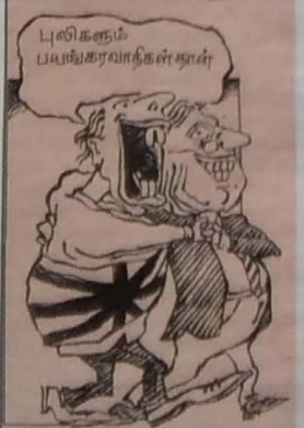
புலிகளும் பயங்கரவாதிகள் ஏன்?

தமிழ்மக்களின் அரசியல் உரிமைக்காகப் போராட்டமும் உண்மையான மக்கள் இயக்கமான விடுதலைப் புலிகள் அமைப்பிற்கு, பிரித்தானிய அரசினால் பயங்கரவாத முறையை குத்தப்பட்டிருக்கின்றது. பயங்கரவாத அமைப்புகள் என்ற பட்டியலில் பிரித்தானிய அரசு தமிழ் விடுதலைப் புலிகள் இயக்கத்தையும் சேர்த்திருப்பது, தமிழ் மக்கள் மத்தியில் ஏமாற்றத்தையும், ஆழ்ந்த கவலைப்படும் ஏற்படுத்தியிருக்கின்றது. பிரித்தானியாவின் இந்த நடவடிக்கையைக் கண்டித்து, தமிழ்ச்சேலத்தில் இன்று பலவிதமான குரல்கள் எழுந்திருக்கின்றன. தேர்வேயின் சமாதான முயற்சிகள் தொடரும் இந்நிலையில், பிரித்தானிய அரசின் இந்த நடவடிக்கை, பொறுப்பற்ற நடவடிக்கையாகக் கருத இயலவில்லை. தேர்வே அரசின் சமாதான முயற்சிக்கு இது பெரும் பாதிப்பை இழைக்கும் எனக் கருத்தத் தெரிவித்துள்ளார் விடுதலைப் புலிகளின் அரசியல் ஆலோசகர் திரு. அனல் பாலசிங்கம் அவர்கள்.