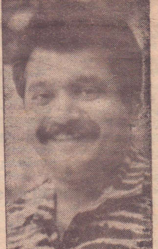
மனித வாழ்வுக் சமூக உறுவுகளும் மேன்மை பெறுகிறது. (5ஆம் பக்கம் பார்க்க)

(யாழ்ப்பாணம்) "ஒரு தாயகத்தைக் கட்டி எழுப்பும்பணி புனிதமானது. இந்தப் புனித பணியில் பங்குகொள்வது எல்லோரதும் தேசிய கடன். ஆயிரமாயிரம் போராளிகளின் அற்புதமான தியாகத்தில் உருவாகி வரும் எமது தாயகத்தை ஒரு உன்னதமான, மேன்மையான சமுதாயமாக மாற்றியமைக்க வேண்டும். இந்த சமூக மாற்றத்திற்கு வழிகாலும் வகையில் சிந்தனையாளர்களும் சிருஷ்டிகர்த்தாக்களும் எமது இயக்கத்திற்கு பக்கபலமாக நின்று பணியாற்ற வேண்டும்". இவ்வாறு இன்று ஆரம்பமாகும் முத்தமிழ்விழா தொடர்பாக தலைவர் பிரபாகரன் விடுத்த வாழ்த்துச் செய்தியில் குறிப்பிட்டுள்ளார். இவ்வாழ்த்துச் செய்தியின் முழுவிவரமும் வருமாறு: மொழி, கலை, சாஸாரம் என்பன, ஒரு தேசிய இனத்தின் கட்டமைப்பிற்கு தூண்சான்ற கனி நொச்சியில் விசிறுகின்றன. ஒரு தேசியத்தின் ஆன்மாவாக திகழ்கின்றன. ஒரு தேசிய நாசரித்திற்கு அத்திவாரமாக அமைகின்றன. மொழியும், கலையும், சாஸாரமும் வளம் பெற்று, வளர்ச்சியும் உயர்ச்சியும் அடையும் பொழுதே, தேசிய இனக்கட்டமைப்பு இறுக்கம் பெறுகிறது. பணம் பெறுகிறது. தேசிய நாசரிம உன்னதம் பெறுகிறது. மனித வாழ்வுக் சமூக உறுவுகளும் மேன்மை பெறுகிறது. (5ஆம் பக்கம் பார்க்க)