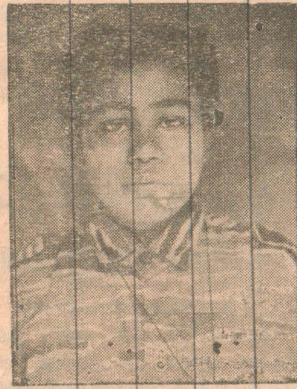
வீரவேங்கை கலைக்கொடி (நடராஜா அம்பிகாதேவி கோயில் தோட்டம்)