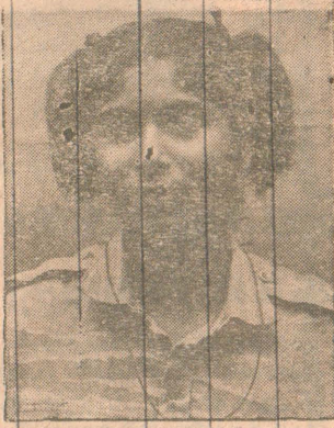
2ஆம் லெப். பானுமதி (புல்பநாதன் தர்சினி சிறிவாரணி சச்சேரி நல்லூர் வீதி, யாழ்ப்பாணம்)