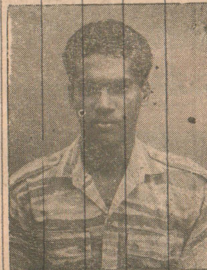
லெப். திருவருள் (தம்பையாலை கைலநாதன் வேரவில், பூநகர்.)