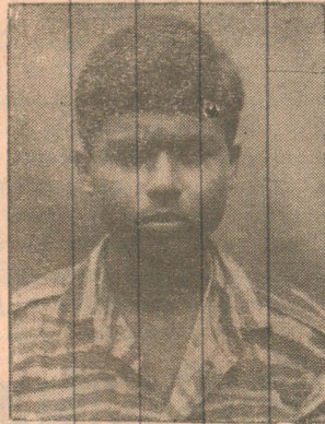
(வில்வம்) (ஜெப்பால்பர்னாந்து பீலிக்ஸ் நொனால்ட் வெற்றிலைக்கேணி, யாழ்.)