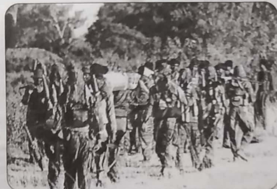
யின் போரியல் சாதனைகளை என்னி வாழ்த்துக் கூறுகின்றார் முத்த தளபதி கேள்ஸ் கருணா

'இன்றுவரை இந்தப் படையணியின் ஊழல் தளபதிகள், அணித்தலைவர்கள், போராளிகள் எல்லாரு புக்த கணங்களில்