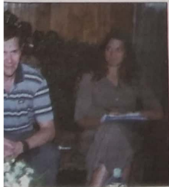
கனடா தேர்வே பிரதிநிதிகள்

அமைதிவழியில் அரசியல் தீவு காணாமறு திவங்க அச்சுறு சம்பந்த நாடுகள் அழுத்தம் கொடுக்கும் போதெல்லாம் ஒப்புக்காக சமாதானக் கோரிடுவதும் பின்னர் சதிமுயற்சிகள் மூலம் சமாதான குழுவைக்கொடுக்கும் சிங்களத்து அரசியல் வடிவமாதும்.