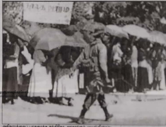
அதிர்த்துப் பாதகாக சத்திரிக அரசாங்கம் முயல்கின்றது.

தமிழ் மாணவர்களுக்கு ஏதிராக இராணுவத்தை எவ்வீடுவதன் மூலம் உருவாக்கிக்கும் எழுச்சி உண்மைய நகக்குவதுடன், அதை வைத்து, சிங்கள மக்கள் மத்தியில் இவ்வாத உணர்ச்சியைக் கிளறி அதன் மூலம் எதிர்க்கட்சியினரை வாயடைக்க வைத்து தனது