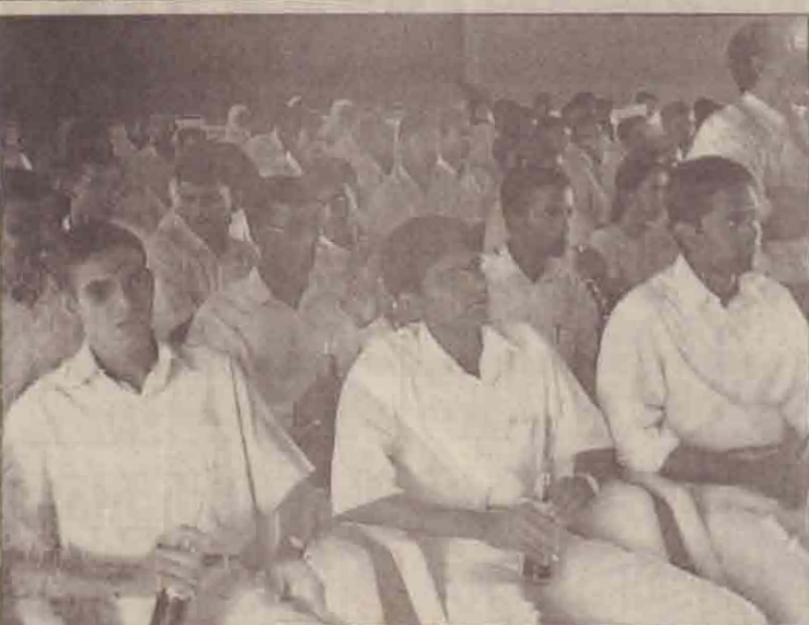
மட்டக்களப்பு மாவட்டத்தில் மகாபொல புலமைப்பரிசில் பெற்ற மாணவர்கள். இவர்களுக்கான புலமைப்பரிசில்கள் நேற்று முன்தினம் மட்டு. அரசாங்க அதிபர் தலைமையில் நடைபெற்ற நிகழ்வில் வைத்து வழங்கப்பட்டது.