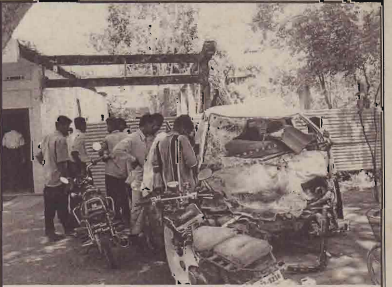
கொக்காவில் பகுதியில் நேற்று முன்தினம் நடந்த கோர வாகன விபத்தில் சேதமடைந்த கைஏஸ் வாகனத்தை நேற்று மக்கள் பார்வையிடுவதைப் படத்தில் காணலாம்.

இப்பகுதியில் நீண்ட காலமாக முன்பள்ளி இல்லாத நிலை இருந்து வந்ததை குறிப்பிடத்தக்கது. (பா)