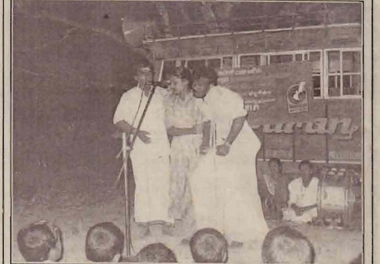
உதயநகர், இரணைமடு, ஜெயந்திநகர் ஆகிய இடங்களில் மகளிர் கலைபண்பாட்டுக் கழக கலைஞர்களால் கண்ணிவெடி மற்றும் வெடி பொருட்கள் தொடர்பான விழிப்புணர்வை மக்கள் மத்தியில் ஏற்படுத்தும் பொருட்டு இந்நிகழ்வு நடைபெற்று வருகின்றது. (பா)

(அலுவலக செய்தியாளர்) கிளிநொச்சியில் யுனிசெவ் நிறுவனத்தின் வெண்பூர் செயற்கை உறுப்பு தொழில்நுட்ப நிறுவனத்தினால் "ஒருகணம்" எனும் தெருவெளி நாடகம் காண்பிக்கப்பட்டு வருகின்றது. நேற்று முதல் மக்கள் மீள்குடியே நிறுவும் கிளிநொச்சி, இரத்தினபுரம்,