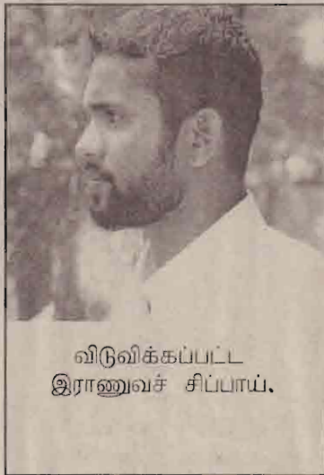
விடுவிக்கப்பட்ட இராணுவச் சிப்பாய்.