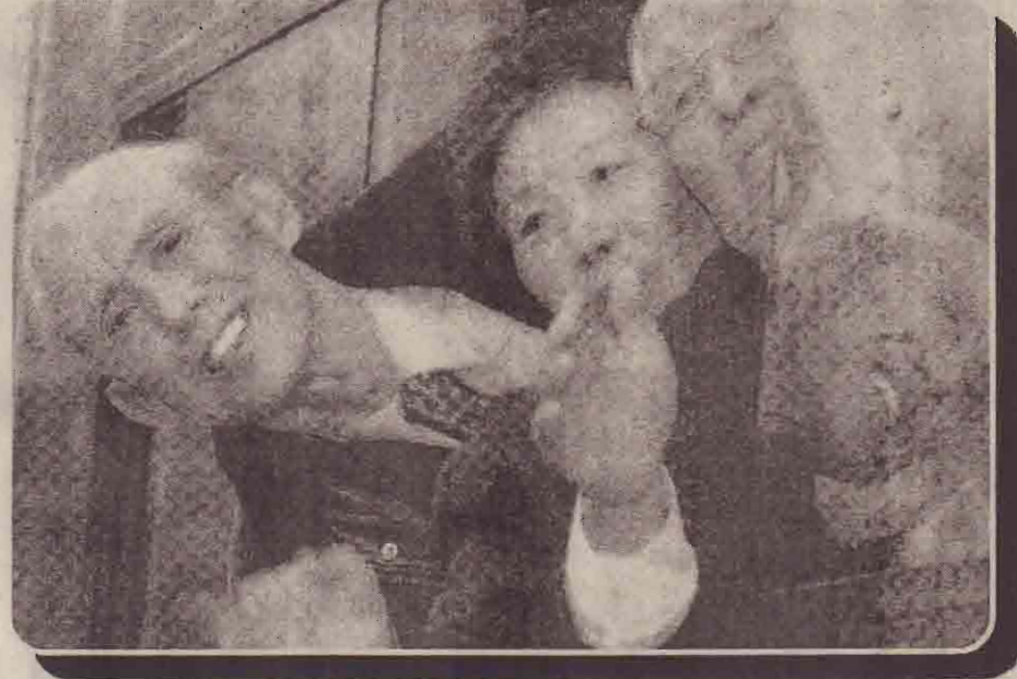
50 வருடங்களின் பின் உறவுகளைக் கண்ட மகிழ்வில் தென்கொரியர்கள்

1953 ஆம் ஆண்டு ஏற்பட்ட போர் நிறுத்த உடன்படிக்கையை கைவிட வேண்டிய நிலை உருவாகும். என்று வட கொரியா, அமெரிக்கா மீது எச்சரிக்கை விடுத்துள்ளது. காரணம் அணு ஆயுதப்பிரச்சினை தொடர்பாக இருதரப்பு பேச்சு நடத்த அமெரிக்கா மறுத்திருப்பதை வட கொரியா வன்மையாகக் கண்டித்துள்ளது. வட கொரியாவின் இன்றைய பொருளாதாரத்தையும் வளர்ச்சியையும் தடுக்கும் முகமாகவே இவ்வணுவாயுத சர்ச்சையை ஏற்படுத்துவதாக வட கொரிய வெளியுறவுச் செயலகம் குற்றம் சாட்டியுள்ளது. அணுவாயுத சர்ச்சை தொடர்பாக வடகொரியாவிற்கும் அமெரிக்காவிற்கும் மிடையே பேச்சுக்கள் மூலம் தீர்த்துக்கொள்ள வடகொரியா அழைப்பு விடுத்தது. இவ்வழைப்பினை, கடந்த 18 ஆம் திகதி அமெரிக்கா நிராகரித்துள்ளதோடு வட கொரியாவின் ரகசிய அணுவாயுதத் திட்டங்களைக் கைவிடச் செய்ய பல தரப்பு பேச்சுக்கள் தான் பலனளிக்கும் என அமெரிக்கா தெரிவித்திருக்கின்றது.