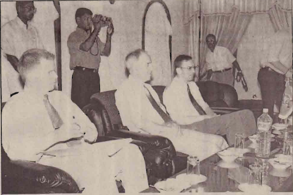
தேசியத் தலைவருடனான சந்திப்பில் கண்காணிப்புக் குழுவினர்