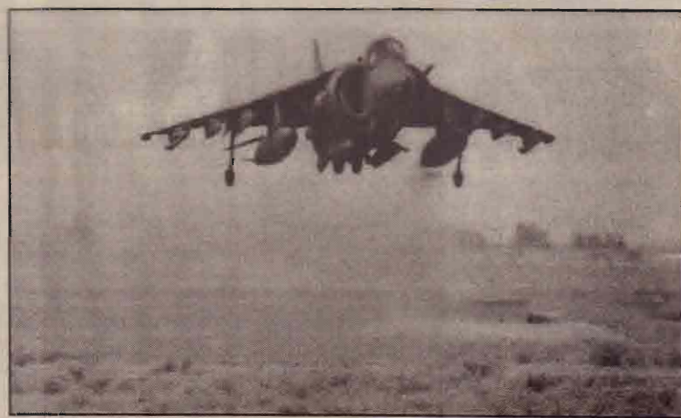
பிரிட்டனின் ரோயல் விமானப் படைக்குச் சொந்தமான GR-7 என்ற தாக்குதல் விமானம் வளைகுடா தளம் ஒன்றிலிருந்து கிளம்பிச் செல்கிறது.

இந்நிலையில், தீர்மானம் வெற்றிபெற வேண்டுமானால் ஒன்பது நாடுகள் ஆதரவு தெரிவிக்க வேண்டும் என்பதும் இங்கு குறிப்பிடத்தக்கதாகும்.