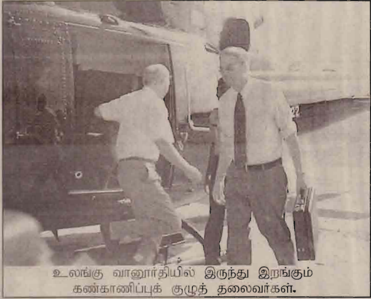
உலங்கு வானூர்தியில் இருந்து இறங்கும் கண்காணிப்புக் குழுத் தலைவர்கள்.