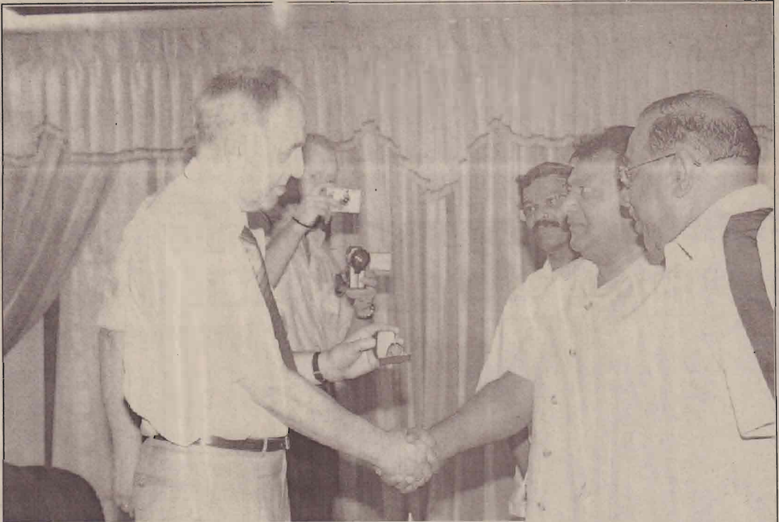
தேசியத் தலைவரிடம் நினைவுப் பரிசைப் பெற்றுக்கொண்ட பின்னர் கைலாகு கொடுக்கும் புதிய கண்காணிப்புக்குழுத் தலைவர்.