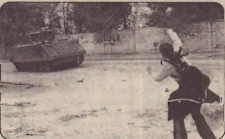
மேற்குக் கரையின் நேப்பிள்ஸ் நகரில் இஸ்ரேலிய டாங்க் ஒன்றின் மீது கல்லெறியும் பலஸ்தீன பள்ளிமாணவி

வரும் உடங்குகின்றனர். ஏப்ரல் 12ஆம் திகதி தொடக்கம் மே மூன்றாம் திகதிவரை தொடர்பாக சனாதிபதி தேர்தலையும் உள்ளூராட்சித் தேர்தலையும் அந்நாடு நடத்தவுள்ள வேளையில் இந்தச் சம்பவம் இடம்பெற்றது. அதே வேளை கிளர்ச்சியாளர்களும் அரசிற்கு காலக்கெடு விதித்துள்ளமை தெரிந்ததே.