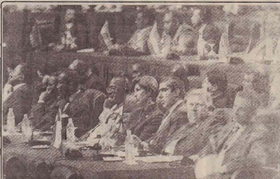
அணிசேரா நாடுகளின் மாநாட்டின்போது

இந்தியா ஒரு பிராந்திய வல்லரசு. துணைக் கண்டத்திலேயே இராணுவ