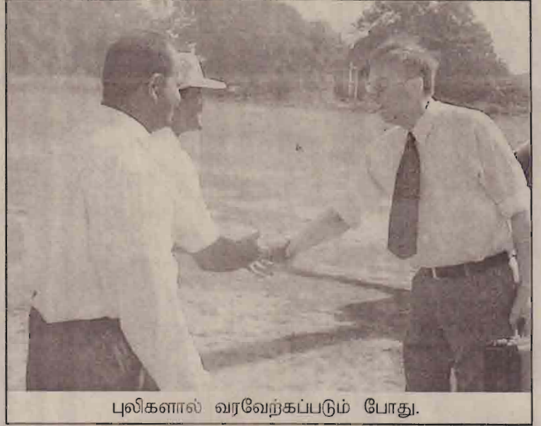
புலிகளால் வரவேற்கப்படும் போது.