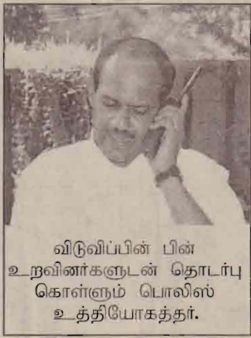
விடுவிப்பின் பின் உறவினர்களுடன் தொடர்பு கொள்ளும் பொலிஸ் உத்தியோகத்தர்.