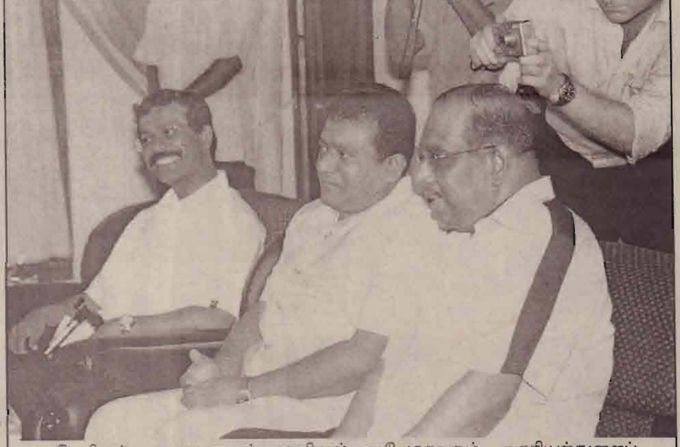
தேசியத் தலைவருடன் அரசியல் ஆலோசகரும், அரசியந்துறைப் பொறுப்பாளரும்.