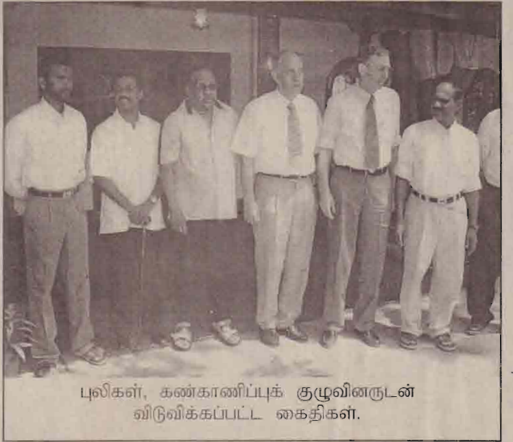
புலிகள், கண்காணிப்புக் குழுவினருடன் விடுவிக்கப்பட்ட கைதிகள்.