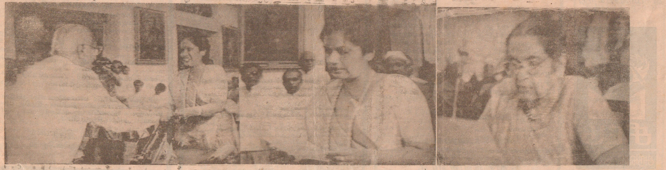
முதலாவது படத்தில் நேற்று நடைபெற்ற பதவி ஏற்பு வைபவத்தின்போது சந்திரிகா குமாரணதுங்க ஜனாதிபதி டி.பி. விஜேதுங்க விடம் இருந்து பதவிப் பிரமாணப் பத்திரத்தைப் பெற்றுக் கொள்வதையும் இரண்டாவது படத்தில் சத்தியப் பிரமாணம் செய்வதையும் முன்றாவது படத்தில் யொ.ஐ. முன்னணியின் தலைவியான சிறிமாவோ பண்டாரநாயக்கா அமைச்சராக சத்தியப் பிரமாணம் செய்வதையும் காணலாம்.