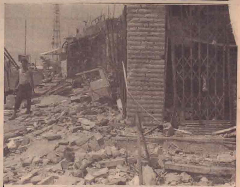
சராக்கின் பஸ்ரா நகரில் நேற்று பொலிஸ் நிலையம் ஒன்றின் முன்பாக நடைபெற்ற கார்க்குண்டு வெடிப்பு

பொதுச் செயலாளர் இவர்களின் இராஜினாமாக்கடித்ததை ஏற்கும் போது அதனைத் தேர்தல் ஆணையாளருக்கு அறிவிக்கவேண்டும் அல்லது அவர்கள் தேர்தலில் வெற்றி பெற்றது அல்லது தேசியப்பட்டியல் மூலம் நியமிக்கப்பட்டது பற்றிவர்த்த மானிமூலம் அறிவிக்கவேண்டும் இந்த நிலைமைகளால் பாராளுமன்ற உறுப்பினர் அதிகாரிகளின் மட்டத்தில் குழப்ப நிலை தோன்றியுள்ளது.