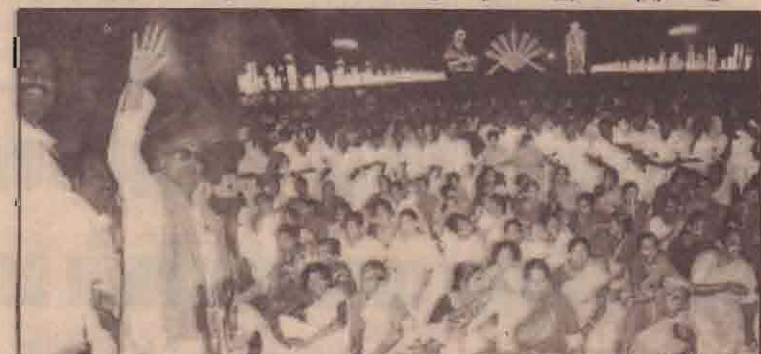
தமிழகத்தின் கடலூரில் நேற்று முன்தினம் நடைபெற்ற மக்களவை தேர்தல் பிரச்சார கூட்டத்தில் தி.மு.க தலைவர் மு.கருணாநிதி.

செய்திருந்ததும் தெரிவித்தே. ஆக்கிரமித்திருக்கும் டிமுர் 5ரை பிரதேசத்தின் சில பகுதியிலிருந்து தான் வெளியேற முடியாதென இஸ்ரேல் அறிவித்ததை அமெரிக்க சனாதிபதி ஆதரித்தான் இதனை அடுத்தே யோர்தானிய மன்னர் அப்துல்லா தனது அமெரிக்க விஜயத்தை ரத்துச் செய்துள்ளார்.