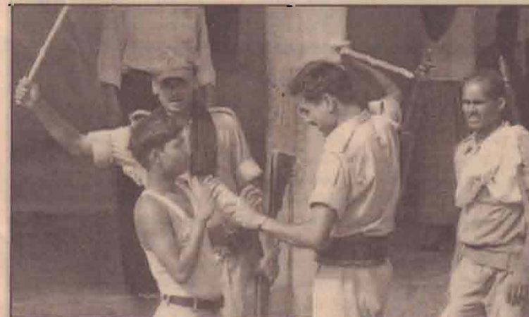
இந்திய மக்களவை தேர்தல் முதல்கட்ட வாக்களிப்பு திணைமன்ற நேற்று முன்தினம் வன்முறையில் ஈடுபட்ட இளைஞனொருவர் பொலிசாரினால் தாக்கப்படுகின்றார்.

இதனையடுத்து இந்த மனுவிடும் விசாரணை நடத்திய தேர்தல் ஆணையம், ரெபுபிளிக் தொகுதிக்கு கூடுதல் மேற்பார்வையாளர் ஒருவரை நியமிக்க முடிவு செய்துள்ளது. அத்துடன் பதற்றம் நிறைந்ததாக பிரியங்கா குறிப்பிட்ட வாக்குச்சாவடிகளில் வாக்களிப்பின் போது விடியோ எடுக்கவும் முடிவு செய்து நேற்று உத்தரவிட்டுள்ளது.