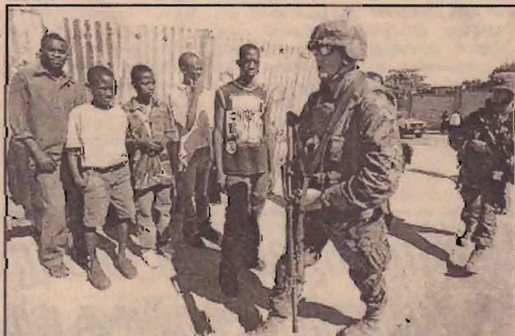
ஹெயிட்டி தலைநகர் போட்ச்டீவ் பிரின்ஸில் ரேரத்துப் பணியில் ஈடுபட்டுள்ள அமெரிக்கப் படையினரை அவதானிக்கும் ஹெயிட்டி இளைஞர்கள்.

அஸ்ரா துறை முகநுழைவாயிலின் இரு இடங்களில் ஒன்றின் பின் ஒன்றாக தாக்குதல் நடைபெற்றதாக அறிவிக்கப்படுகிறது. பலஸ்தீனத்தின் ஹமாஸ், அல்-அக்ஷா தீவிரவாத அமைப்புகள் இந்தத் தாக்குதலுக்கு உரிமை கோரியுள்ளன. அத்தோடு கடந்த 7ஆம் திகதி இஸ்ரேலிய இராணுவத்தின் தாக்குதலில் காஸாப்பகுதியில் 14 பலஸ்தீனர்கள் கொல்லப்பட்டமைக்கு பதிலடி கொடுக்கும் வகையில் இது அமைந்துள்ளதாக கூறப்படுகிறது. இது இவ்வாறிருக்க இஸ்ரேல்- பலஸ்தீன பிரதமர்கள் இடையிலான திட்டமிடப்பட்ட சமாதானப் பேச்சுவார்த்தை இந்த தாக்குதலால் ஒத்திவைக்கப்பட்டுள்ளதாக அறிவிக்கப்பட்டுள்ளது.