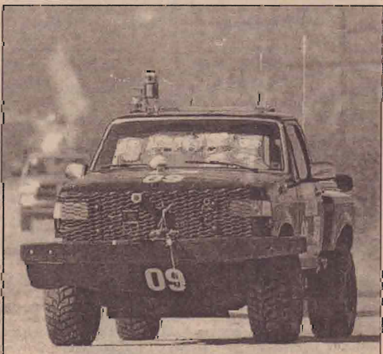
அமெரிக்காவின் கலிபோர்னியா, மொஜெல் பாலவைவளப் பிரதேசத்தைக் கடந்து 140 மைல் தூர ஓட்டப் பந்தயத்தில் பங்குபற்றும் றோபோ மூலம் தியக்கப்படும் வாகனம் அமெரிக்கப் படையில் ரோபோக்களை இணைக்கும் திட்டத்திற்கையைய இந்தப் பரிசோதனை நேரில் காணப்பட்டது.