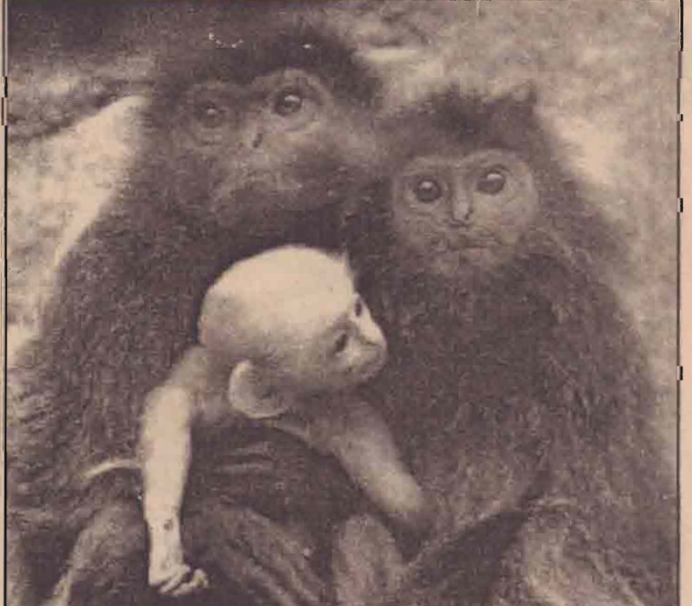
யாவா, சுமத்திரா தீவுகளில் அடிதூண் காணப்படும் சிவ்வாலைங்கர் இனக் குரங்குகள் தமது குழந்தைகளுடன் காணப்படுகின்றன.

ஸ்பெயினில் நேற்று முன்தினம் நடைபெற்ற தேர்தலில் சோஷலிசக் கட்சி 43வது வாக்குகளைப் பெற்று வெற்றியீட்டியுள்ளது. இதேவேளை, ஆளும் மத்திய வலதுசாரி மக்கள் கட்சி 38 வீத வாக்குகளையே பெற்றது. எட்டு வருட கால ஆளும் கட்சியின் ஆட்சியை சோஷலிச கட்சி கைப்பற்றியுள்ளமை குறிப்பிடத்தக்கது. ஸ்பெயினில் தேர்தலுக்கு முன்னதாக இடம் பெற்ற பாரிய குண்டுத் தாக்குதல் தேர்தலை பாதித்திருந்ததாக கூறப்படுகின்றது. 67 சதவீத மக்களை வாக்களித்திருந்தனர்.