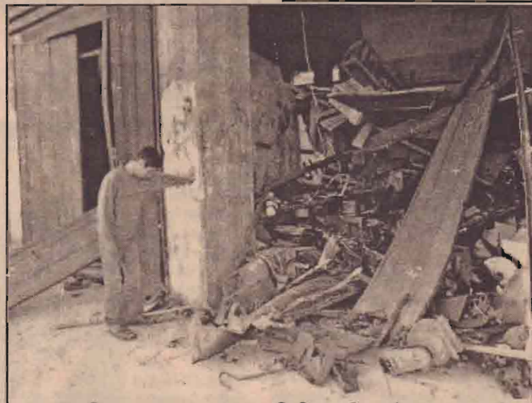
இஸ்ரேலிய உலங்குவானூர்தியின் பீரங்கித்தாக்குதலில் சேதமுற்ற தனது உலோக வேலைத் தளத்தை அவதானிக்கும் பலஸ்தீனர் ஒருவர்.