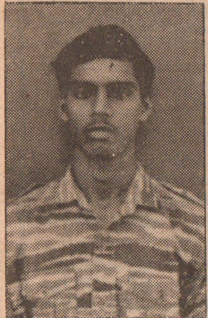
கப்டன் துரையாசன் நகுலன்

வைத் தழுவிக்கொண்டனர். வீரச்சாவைத் தழுவிக்கொண்ட, (6ஆம் பக்கம் பார்க்க)