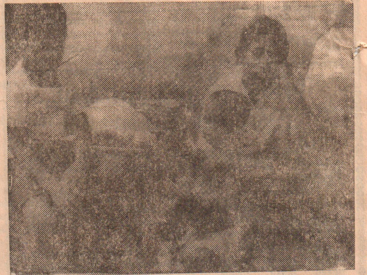
இழப்புகளின் பின்னும் இருகுழந்தைகளையும் காப்பாற்றித்தமிழ் நாட்டுக்கு அகதியாய்ப் போய்ச்சேர்ந்த ஒருதாய் சோகமே உருவாக அமர்ந்திருக்கிறார்.

இந்த உணவுக் கப்பல் மூலம் லைத்தீவில் உணவுப் பொருட்களை இறக்குவதில் ஏற்படும் தாமதம் காரணமாகவே யாழ். வரதாமதம் ஏற்பட்டுள்ளது. மேலும் இக்கப்பல் இன்று வந்தாலும் பொருள்களை திங்கட்கிழமையே இறக்கப்படும். இதனால் கொழும்புக்கான தபால் சேகரிப்பு களை தாராளமாக திங்கட்கிழமை வரை செய்யலாம் என்று யாழ். செஞ்சிலுவைச் சங்கம் அறிவித்துள்ளது (ம)