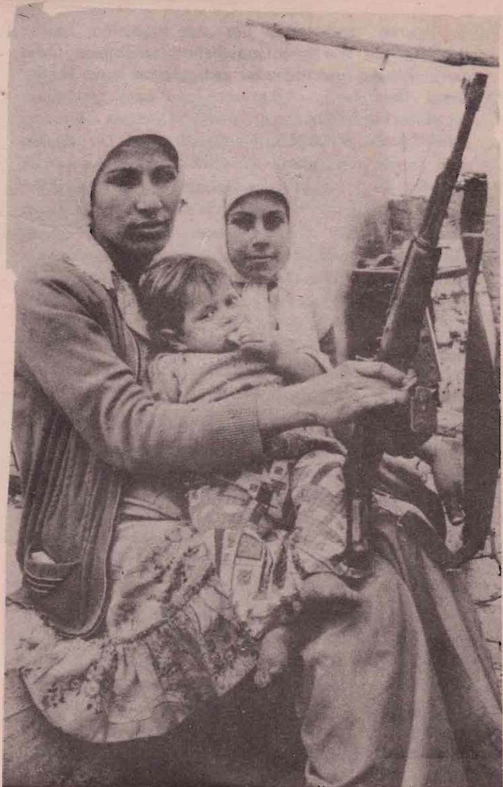
குழந்தையையும் துப்பாக்கியையும் கரங்களில் ஏந்தி நிற்கும் பாலஸ்தீனியப் பெண் போராளி.