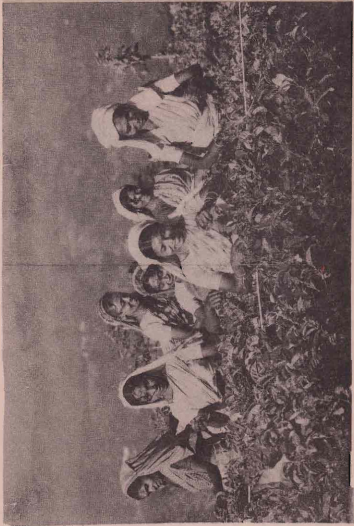
#விரக்கமற்ற சுரண்டலுக்கு இலக்காகியுள்ள மலையகப்பெண் தொழிலாளர்