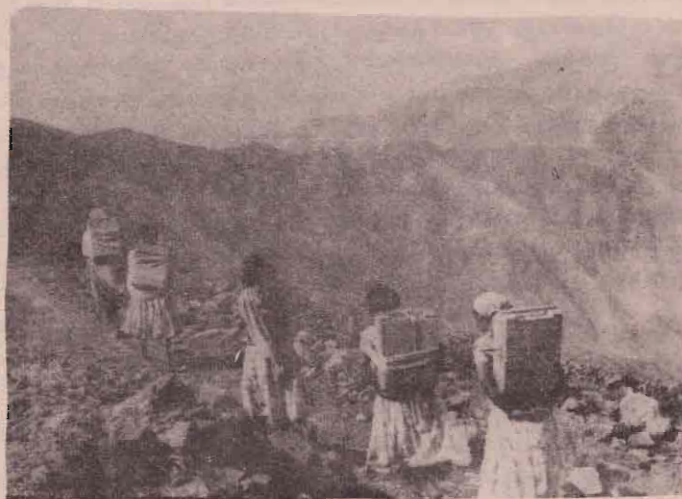
கொரில்லா வீரர்களுக்கு ஆயுதத்தள பாடங்களைத் தாங்கிச் செல்லும் எரீத்திரியப் பெண் போராளிகள்

மீட்கும் இந்த இலட்சியப் போராட்டத்தில் எத்தனையோ புரட்சிப் பெண்கள் வீர மரணமும் எய்தியுள்ளனர். இராணுவ ரீதியில் மட்டுமின்றி, விடுதலைப் போராட்டத்தின் சகல நிலைகளிலும்—வைத்தியப் பிரிவு, கல்விப் போதனை, பிரச்சாரம், சமூக நலன் ஆகிய பல்வேறு துறைகளிலும் எரீத்திரியப் பெண்கள் பணிபுரிந்து தேசியப் போராட்டத்தை முன்னெடுத்துச் செல்கின்றனர்.