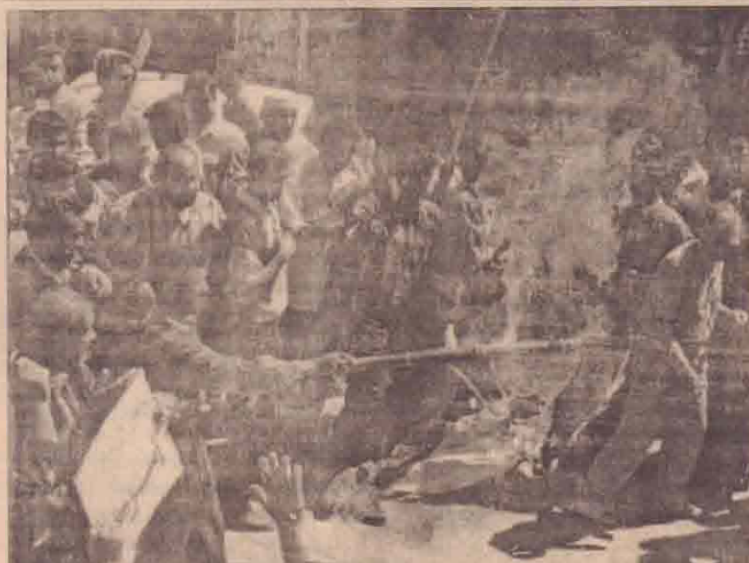
ஹமாஸ் இயக்கத்தின் ஸ்தாபகரும் தலைவருமான ஷேக்அகமத் ஜஷீன் இஸ்ரேலிய தாக்குதலில் பலியானதற்கு எதிர்ப்புத் தெரிவிக்கும் முகமாக கர்பலாநகரில் இஸ்ரேலியக் கொடியை எரிக்கும் ஈரக்கியர்.