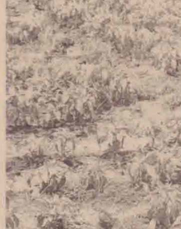
தாவல்பாசனத்திற்குத் தயார்படுத்தப்பட்டுள்ள கறிமிகளாய்செய்கைகள்

மேற்படி திட்டத்தின் மூலம் நெடுங்கேணி ஒலுமடுக்கிராமத்தில் வெங்காயம், மற்றும் கறிமிகளாய்ச் செய்கையை விவசாயி ஒருவர் மேற்கொண்டு வருவதுடன், பெரும் பலனையும் பெற்று வருகின்றார்.