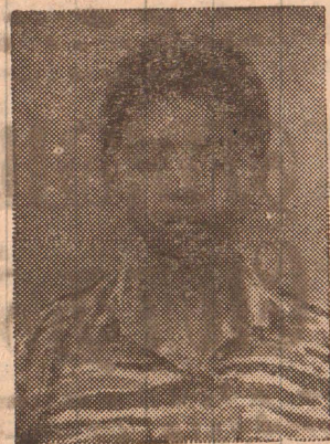
வீரவேங்கை குலேந்திரன் கனகரத்தினம் சாந்தகுமார் தூர்க்காவீதி, 4ஆம் வட்டாரம் அரசடி வீதி, புதுக்குடியிருப்பு முல்லைத்தீவு.