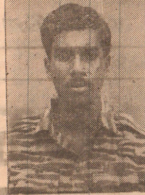
கப்டன் குட்டி (அன்பு)

ஜயம்பிள்ளை சிவகுமார் மாசியப்பிட்டி, சண்டிலிப்பாய்