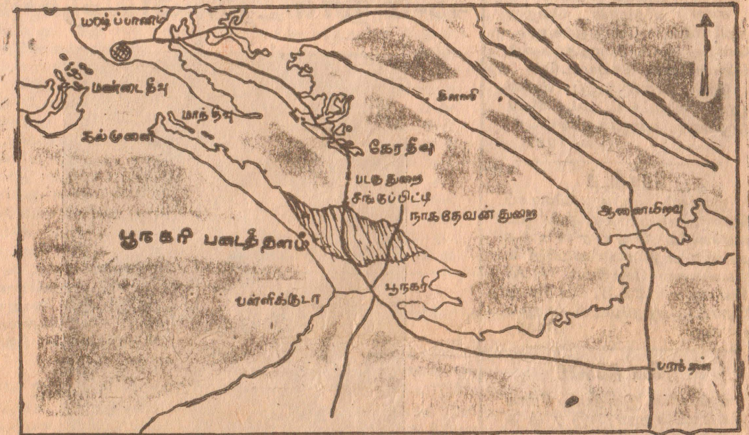
போதல் 'இடம் பெற்ற' பூநகரிப் பிரதேசம்

நேற்று அதிகாலை 1-45 மணியளவில் விடுதலைப் புலிகளின் படையணிகள் பூநகரித் தளம்மீது பாரிய தாக்குதலைத் தொடுத்தன தமிழ் மக்களின் பிரயாணத்தடைக்கு வதே விடுதலைப்புலிகளின் பிரயோகம் தான நோக்கமாக இருந்தது. இத்தகக் கேந்திர முக்கியத்துவம் வாய்ந்த தளம் பல இராணுவ முகாம்களையும், மினி முகாம்களையும், கடற்படைத் தளம் (8ஆம் பக்கம் பார்க்க)