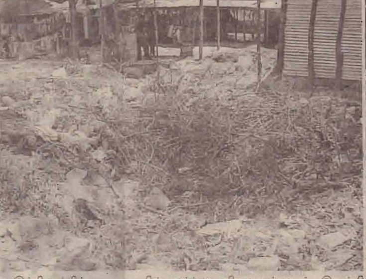
இக்கிணற்றிற்கருகாமையில் வர்த்தக நிலையங்களும் இயங்கி வருகின்றன.

கிளிநொச்சி பொதுச்சந்தை வளாகத்திலுள்ள இடிந்த கிணற்றினுள் குப்பை சுழல்கள் நிறைந்து காணப்படுகின்றன.