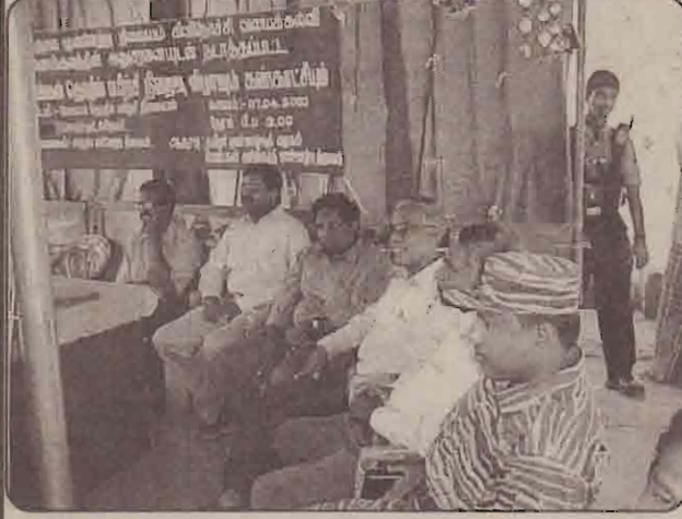
பரிசளிப்பு நிகழ்வு மேடையில்...