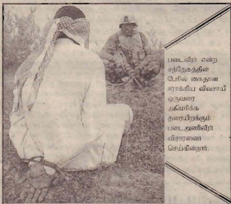
படைவீரர் என்ற சுந்தேகத்தின் பேரில் கைதான ஈராக்கிய விவசாய ஒருவரை அமெரிக்க தரையிறக்கும் படைஅணிவீரர் விசாரணை செய்கின்றார்.