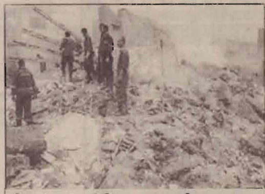
விமானக்குண்டு வீச்சில் தரைமட்டமாகிய கட்டடங்கள்