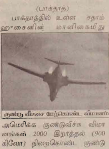
குண்டு வீசரை மேற்கொண்ட விமானம்

அமெரிக்க குண்டுவீச்சு விமானங்கள் 2000 இராத்தல் (900 கிலோ) நிறைகொண்ட குண்டு