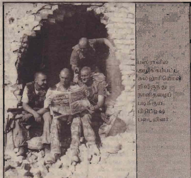
பஸ்ராவில் துழிக்கப்பட்ட கல்லூரிமொன்று நின்றிருந்து நாள்தோறும் படிக்கும் பிள்ளை ஒரு பையினர்

புதுடில்லிக்கு மூன்று நாள் பயணம் மேற்கொண்டுள்ள அவர் மேலும் தெரிவிக்கையில் விமான பயணிகளின் எண்ணிக்கை குறைந்து சுற்றுலாப் பயணத்துறை மோசமாகப் பாதிக்கப்பட்டிருப்பதாகக் கூறினார்.