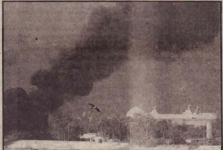
பாக்தாத்திலுள்ள சதாம் ஹுசைன் மாளிகையில் குண்டு வெடிப்புக்களால் எழும் புகைமண்டலத்தினாலே பறவைகள் பறந்து செல்கின்றன.

மேலும், இரவு வேளைகளில் கூட்டுப் படைகளின் விமானத் தாக்குதலின் வேகம் சற்றுக் குறைவடைந்துள்ளதாக அறிவிக்கப்படுகிறது. அமெரிக்க படைகள் பாக்தாத்தின் பல பகுதிகளுக்குள் ஊடுருவியிருப்பதே இதற்கான காரணம் எனவும் கூறப்படுகிறது.