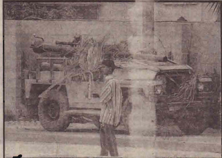
பாக்தாத்தில் ஈராக்கிய பீரங்கி வாகனொன்றைக் கடந்து செல்லும் சிறுவன்