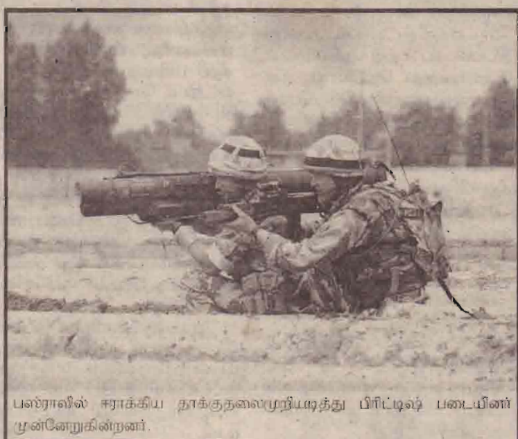
பஸ்ராவில் ஈராக்கிய தாக்குதலைமுற்றியடித்து பிரிட்டிஷ் படையினர் முன்னேறுகின்றனர்.

ஈராக்கில் இடைக்கால அதிகார சபை ஒன்றை ஏற்படுத்துவது குறித்து ஆராய விசேட குழு ஒன்றை இவ்வாரம் அங்கு அனுப்ப