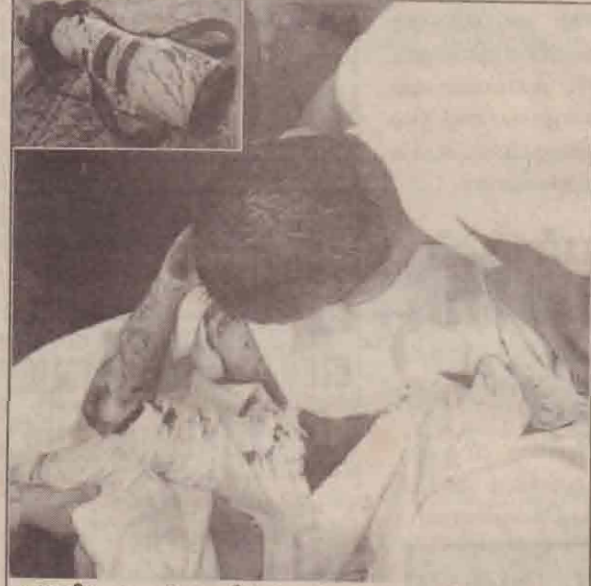
அமெரிக்கத் தாக்குதலில் கொல்லப்பட்ட கவிடன் நாட்குப் பத்திரிகையாளர் (வைத்தியசாலையில் அனுமதிக்கப்பட்டிருந்த வேளையில்...)

பாக்தாத்தில் அமெரிக்கப் படைகள் நடத்திய மூன்று வெவ்வேறு தாக்குதல்களில் மூன்று ஊடகவியலாளர்கள்