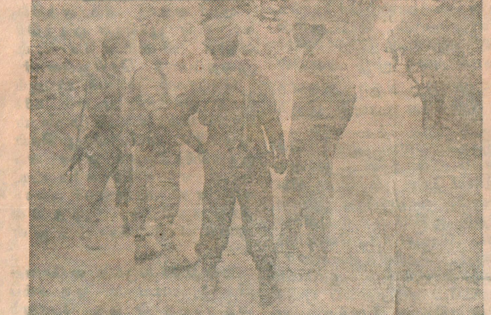
‘கஜபார’ இராணுவ நடவடிக்கையை எதிர்கொள்வது குறித்து தளபதி பால்ராஜ், தளபதி சொர்ணம் ஆலோசனையிடுகின்றனர்.