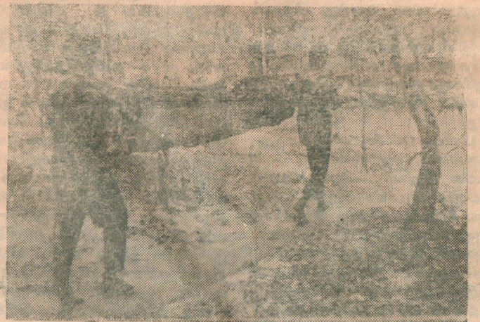
“கஜபார நடவடிக்கை”யின் போது காயமடைந்த போராளிகள் மருத்துவமனைக்கு எடுத்துச் செல்லப்படுகின்றனர்.