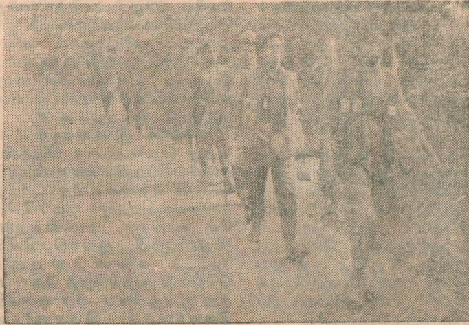
கஜபார நடவடிக்கையை முறியடிக்கச் செல்லும் மகளிர் படையணி

“எமது சொந்த மண்ணில் ஒரு பிடி மண்ணைக்கூட அந்நியனுக்கு அடிமைப்பட நாம் விட்டு விடமாட்டோம் என்ற உறுதியுடன் தான் ‘கஜபார’ இராணுவ நடவடிக்கையை நாம் ஒவ்வொருவரும் எதிர்கொண்டோம்” என்று கூறினார்.