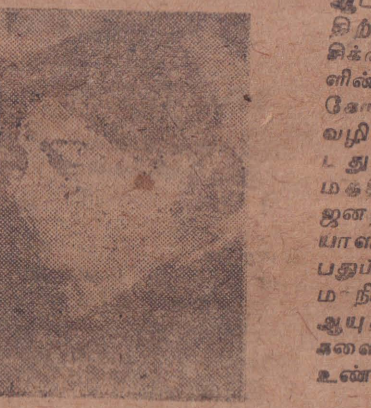
கடந்த மூன்றுமாத கால

அதேவேளை, செல்வி ஜெயலலிதா இலங்கைத் தமிழருக்கும், விடுதலைப் புலிகளுக்கும் எதிராக மேற்கொள்ளப்பட்டவரும் நடவடிக்கை தமிழகத்தின் எதிர்மறைவான விளைவுகளை ஏற்படுத்தத் தொடங்கியுள்ளது. இலங்கைத் தமிழரின் போராட்டத்திற்கு ஆதரவான சக்திகளும், தமிழ் நாட்டின் சுயநிர்ணய உரிமைக்குக் குரல் கொடுக்கும் சக்திகளும்