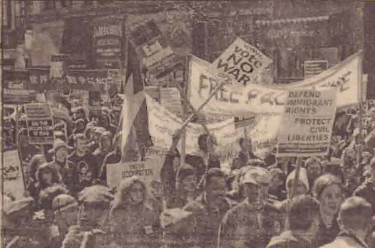
அமெரிக்கப்படைகளை மீளப்பெறுமாறு கோரி அமெரிக்காவின் மன்னாட்டின் நகரில் நடைபெற்ற ஆர்ப்பாட்டத்தில் கலந்துகொண்ட மக்கள்.

ஈராக்மீது அமெரிக்காவின் தலைமையிலான கூட்டுப்படைகள் போர்தொடுத்து ஒருவருட நிறைவை முன்னிட்டு ஈராகைவிட்டு அமெரிக்கப்படைகளை வெளியேற்றமாறு கோரி உலகின் பல்வேறு நாடுகளில் நடத்தப்பட்ட ஆர்ப்பாட்டப் பேரணியில் கோடிக்கணக்கானோர் கலந்துகொண்டனர்.