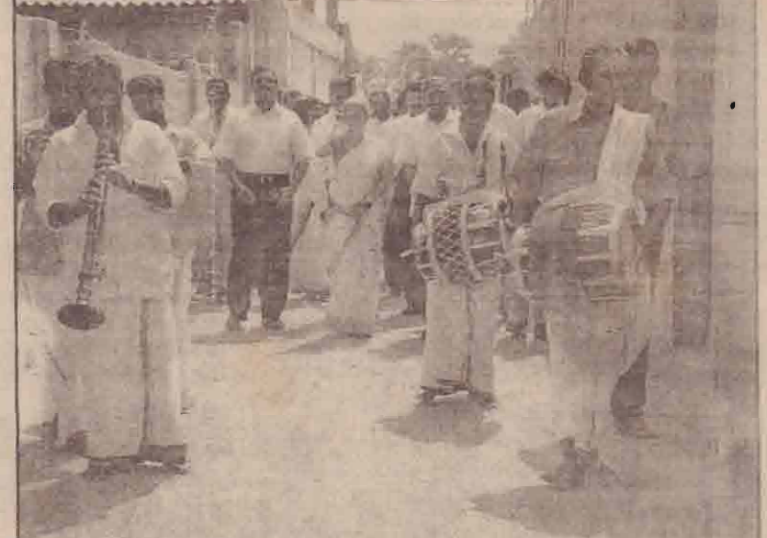
அங்குராப்பண நிகழ்வில் விருந்தினர்கள் மங்கல இசையுடன் அழைத்துவரப்படுகின்றனர்.

இன்று உருவாக்கப்படுகின்ற இந்தச் சங்கம் எதிர்வார்க்கின்ற இலக்கினை எட்டி எமது மக்களுக்கு நல்ல சேவையைப் புரிந்து மக்களைக் காத்து நல்லதொரு பெரும்பணியை ஆற்ற அனைவரும் ஒத்துழைக்க வேண்டும். அத்துடன் இதன் எதிர்வாப்பை நிறைவேற்றக் கூடிய வகையிலே மருத்துவர்கள், மருத்துவக்கலாநிதிகள் எடுக்கின்ற எந்த முயற்சிக்கும் தமிழிழ விடுதலைப்புலிகளாகிய நாம் என்றும் பக்கத் துணையாக நிற்போம் எனவும் தெரிவித்தார். (லோ, பி)