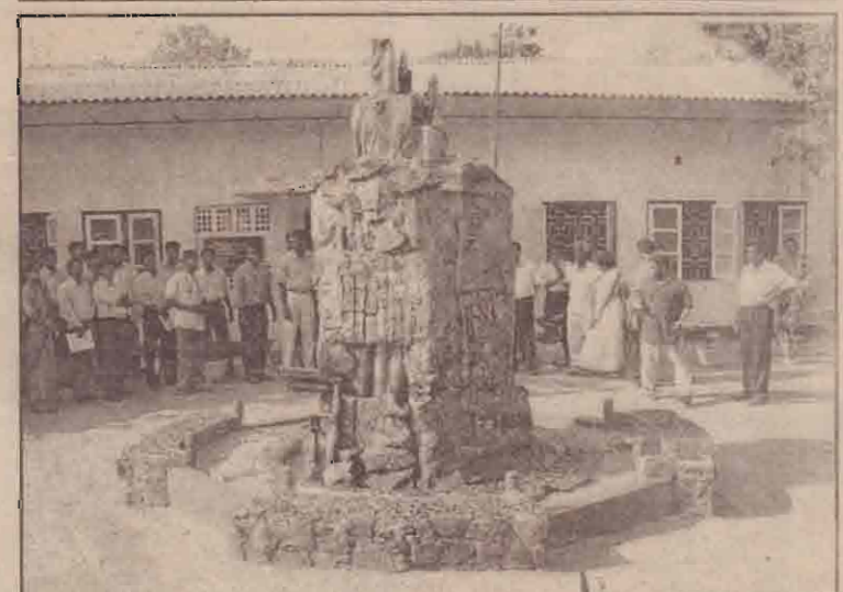
கிளி. மருத்துவமனையின் யுத்தகால அழிவை நினைவுகூர்ந்து அமைக்கப்பட்டுள்ள நினைவுத்தூபி.