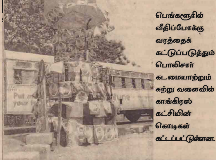
பெங்களூரில் வீதிப்போக்கு வரத்தைக் கட்டுப்படுத்தும் பொலிசார் கடமையாற்றும் சுற்று வளைவில் காங்கிரஸ் கட்சியின் கொடிகள் கட்டப்பட்டுள்ளன.

இருந்தது. தேர்தல் ஆணையத்தின் தலையை அடுத்து, யாத்திரை ஒத்திவைக்கப்பட்டுள்ளது. எனினும் தேர்தல் முடியும் வரை யாத்திரை நடத்த முடியாமலும் பிராகஸாம் என்ற எதிர்பார்க்கப்படுகின்றது. இதேவேளை தேர்தல் விதியை மீறியே யாத்திரை நடத்தப்படுவதாக காங்கிரஸ் தேர்தல் ஆணையகத்திடம் முறையிட்ட தையடுத்தே தடைசெய்யப்பட்டுள்ளது.