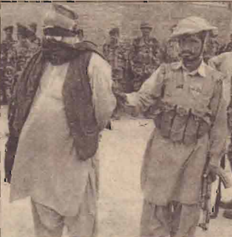
பாகிஸ்தான் படையினரின் நடவடிக்கையில் கைதான அல்-ஹைதா சந்தேகநபர்.

(இஸ்லாமாபாத்) பாகிஸ்தான், ஆப்கானிஸ்தானுடனான தனது எல்லைப் பிரதேசத்தில் மேற்கொண்டுவந்த தேடுதல் நடவடிக்கை மூலம் நூற்றுக்கும் மேற்பட்ட சந்தேகத்திற்குரிய தீவிரவாதிகளைக் கைது செய்துள்ளது. பாகிஸ்தான் இராணுவத்தினால் கைது செய்யப்பட்ட இந்தத் தீவிரவாதிகளில் அல்-ஹைதா இயக்கத்தின் இரண்டாவது தளபதியான ஐமான் அல்-ஐபாகிரியும் அடங்குகின்றாரா எனக் கூறிமுடியாதென பாகிஸ்தான் இராணுவம் தெரிவித்துள்ளது. எவ்வாறாயினும் தீவிரவாதிகளைப் பாதுகாத்ததாகக் கூறப்படும் உஸ்பெஸ் கிஸ்தான் அல்லது செச்சினியாவைச் சேர்ந்த தீவிரவாதத் தலைவர் ஒருவர் கைது செய்யப்பட்டுள்ளதாகவும் பாகிஸ்தான் இராணுவம் தெரிவித்துள்ளது. ஆப்கானிஸ்தான் எல்லையில் இடம்பெற்றுவந்த மோதல்களை அடுத்து கடந்த சனிக்கிழமை முதல்பாகிஸ்தான் இராணுவத்தினர் தீவிர தேடுதலை நடத்திவந்தனர் எனவும் இதில் ஆயிரக்கணக்கான பாகிஸ்தான் இராணுவத்தினர் ஈடுபட்டு வந்ததாகவும் இதன் போது இடம்பெற்ற துப்பாக்கிச் சமரில் சில தீவிரவாதிகள் கொல்லப்பட்டதாகவும் தெரிவிக்கப்படுகிறது. இந்நிலையில் இந்த நடவடிக்கை நேற்றும் தொடர்வதாக அறிவிக்கப்படுகின்றது.