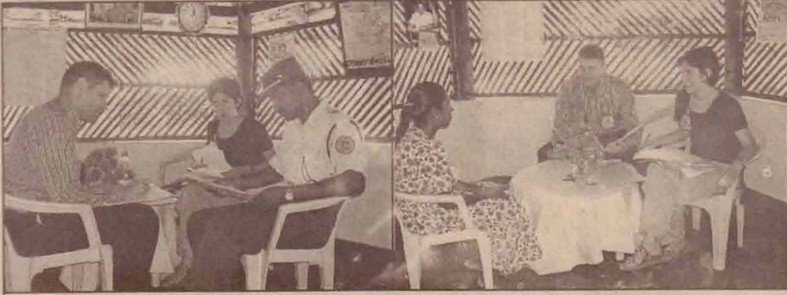
தமிழீழ காவல்துறையின் சீர்திருத்தப்பள்ளிக்கு சர்வதேச செஞ்சிலுவைச் சங்கப் பிரதிநிதிகள் நேற்று முன்தினம் விஜயம் ஒன்றினை மேற்கொண்டனர். கிளிநொச்சியில் அமைந்துள்ள மேற்படி சீர்திருத்தப் பள்ளியிலுள்ள கைதிகளை நேரில் கண்டு அவர்களுடன் கலந்துரையாடி அவர்களுக்கு குறை நிறைகளை கேட்டறிந்தனர்.