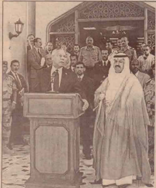
அமெரிக்க ராஜாங்கச் செயலர் கொலின் பவல் ஈராக்கிய சனாதிபதி கஸி அல்ஜவார் அருகிருக்க தலைநகர் பாக்தாத் திலுள்ள அரசு தலைமையகத்தில் பத்திரிகையாளர்கள் மத்தியிலே உரையாற்றுகின்றார்.

கட்டிக்காட்டியுள்ளார். அமெரிக்காவில் தாக்குதலுக்கு இலக்காகக் கூடிய ஒவ்வொரு கேந்திர நிலையத்தைச் சுற்றியும் கோட்டைகளை அமைப்பது மட்டமான செயலென அவர் வர்ணித்துள்ளார்.