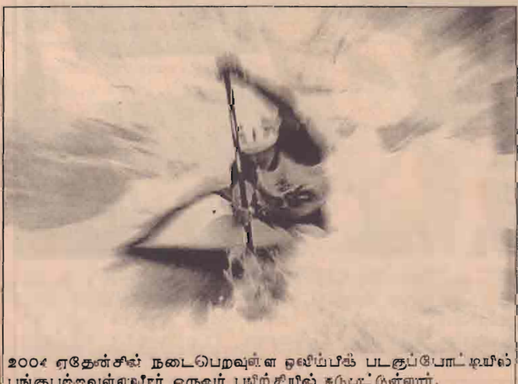
2004 ஏதேன்சை நடைபெறவுள்ள ஒலிம்பிக் படகுப்போட்டியில் பங்குபற்றவுள்ளவீரர் ஒருவர் பயிற்சியில் ஈடுபட்டுள்ளார்.