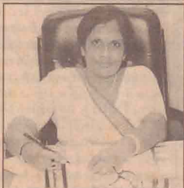
புக்குழுவின் பணி விலக்கிக்கொள்ளப்படாது செயற்பட அனுமதித்தது.

விடுதலைப்புலிகளுக்கும் சீர்திருத்த அரசாங்கத்திற்கும் இடையிலான பேச்சு வார்த்தைகளில் முன்றாம் தரப்பு ஏற்பாட்டாளராக நோர்வே மீண்டும் செயற்பட வேண்டும் எனச் சனாதிபதி சந்திரிகா குமாரதுங்க நோர்வேயிடம் கேட்டுள்ளார். இதேவேளை இதற்கு பதிலளித்த நோர்வேப் பிரதமர் விடுதலைப்புலிகளும் இதே மாதிரியான வேண்டுகோளை விடுக்கும் பட்சத்தில் ஏற்பாட்டாளராகப் பணியாற்றத் தயார் எனத் தெரிவித்துள்ளார்.