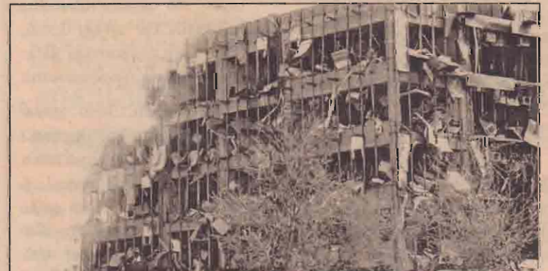
சவுதி அரேபியாவின் ரியாத் நகரில் நேற்று முன்தினம் தீவிரவாதிகள் நடத்திய கார்வெடிசூண்டுதாக்குதலில் அந்நாட்டின் பாதுகாப்புத் துறை அலுவலகம் சின்னாபின்னமாகியிருப்பதைப் படத்தில் காணலாம்.

பிரதேசத்தில் எத்தனை தொகுதிகளை காங்கிரஸ் கைப்பற்றும் எனும் வினாவுக்கு அவர் பதிலளிக்க மறுத்துவிட்டார்.