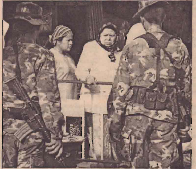
வன்முறை ஒன்றில் கிராமத்தலைவர் ஒருவர் சுட்டுக்கொல்லப்பட்டதையடுத்து தாய்வான் கிராமப்பகுதியில் ரோந்து சுற்றும் தாய்வான் இராணுவத்தினர்.

சவுதி அரேபிய குண்டுவெடிப்பிற்கு சவுதியிலுள்ள அல்-ஹரமேயின் படை பொறுப்பேற்றுள்ளது. தனது இணையத் தளத்தினூடாகவே தாக்குதலுக்கு பொறுப்பேற்றுள்ளது.