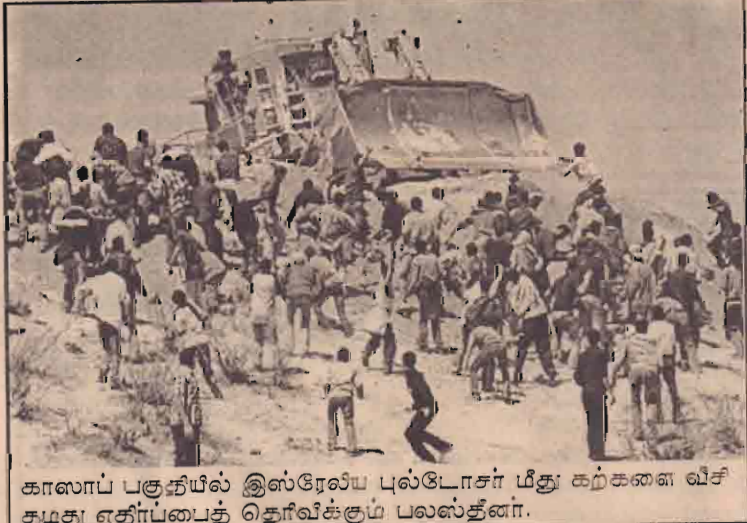
காலாப் பகுதியில் இஸ்ரேலிய புல்டோசர் மீது கற்களை வீசி தமது எதிர்ப்பைத் தெரிவிக்கும் பலஸ்தீனர்.

இந்தக்குற்றச்சாட்டுக்கள் முன்வைக்கப்பட்டுள்ள உலக வங்கியின் நிதி உதவியுடன் அமைக்கப்பட்ட அணைக்கட்டுக்கள் காரணமான ஒருகோடிக்கும் மேலான மக்கள் இடம்பெயர்ந்துள்ளதாகள். பாரிய அளவு நிலப்பரப்பு அணைக்கட்டுக்காக விழுங்கப்பட்டுள்ளது. இவ்வாறு அணைக்கட்டுக்கள் கட்டப்பட்ட நாடுகள் பெரும் கடனாக் குள்த் தள்ளப்பட்டுள்ளன.என்றும்அந்த அறிக்கையில் கூறப்பட்டுள்ளன.