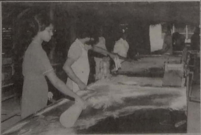
உள்ளூர் உணவு உற்பத்தித் திட்டங்களையும் தமிழீழ பொருளியை மேம்பாட்டுக்கழகம் நடாத்தி வருகின்றது. பெண்கள் உணவு தயாரிப்பில் ஈடுபட்டிருப்பதை யும் காட்டுகிறது.

கொழும்பு மகசீன் சிணைச்சாலையிலிருந்து 828, 804 தமிழர்கள் சாலையில் வைக்கப்பட்டுள்ளதாக மனித உரிமைகள் பணியகம் அறிவித்துள்ளது. இத்த 1920 பேரின் பரபர 1985-90 ஆண்டுக்கிடையில் கைது செய்யப்பட்டு எதுவித விசாரணையுமின்றி சாலையில் வைக்கப்பட்டுள்ளனர்.