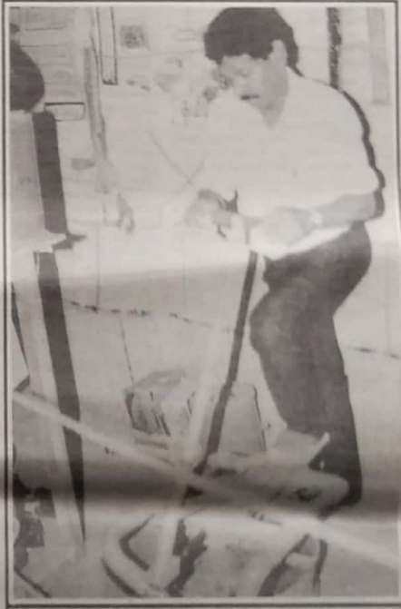
தமிழீழப் பொருளியை மேம்பாட்டுக் கழகத்தினரால் ஒலைக் கைத்தொழிலை இலகுவாக்குவதற்காகச் செய்யப்பட்ட உள்ளூர் இயந்திரத்தைத் தொழிலாளர் சீர்துவர் இயக்குவதை காணலாம்.

கனகசுரம், அம்பலம் நகரம், விநாயகசுரம் ஆகிய இடங்களில்