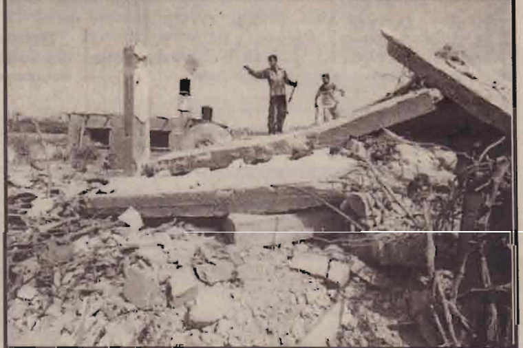
பெய்த என்ற இடத்தில் இஸ்ரேலிய புல்தோசர் துவம்சம் செய்த தமது வீடுகளை அவதானிக்கும் பலஸ்தீனச் சிறுவர்கள்

ஐக்கிய நாடுகள் சபையை கட்டுப்படுத்தும் இந்த பாதுகாப்பு சபையில் அமெரிக்கா, ரஷ்யா, பிரிட்டன், சீனா, பிரான்ஸ் ஆகிய ஐந்து நாடுகள் நிரந்தர உறுப்பு நாடுகளாக இருக்கின்றன. மேலும் பத்து நாடுகள் தற்காலிக உறுப்பு நாடுகளாகக் கழற்சி முறையில் அங்கம் வகித்து வருகின்றன. இந்நிலையில் தன்னையும் நிரந்தர உறுப்பு நாடாக இணைத்துக் கொள்ளுமாறு இந்தியா தொடர்ச்சியாக வலியுறுத்தி வருகின்றது. இதற்கு ரஷ்யா உட்பட பல நாடுகள் ஆதரவு தெரிவித்துள்ள நிலையில் பிரிட்டனும் தற்போது ஆதரவளிக்க முன்வந்துள்ளது. அத்தோடு ஜேம் மனையும், ஐப்பானையும் நிரந்தர உறுப்பு நாடாக இணைக்கவும் பிரிட்டன் வலியுறுத்தியுள்ளது. அதேசமயம், அமெரிக்கா உட்பட பல ஐரோப்பிய நாடுகள் இது விடயத்தில் தொடர்ந்து மௌனம் சாதித்து வருகின்றன இங்கு குறிப்பிடத்தக்கது.