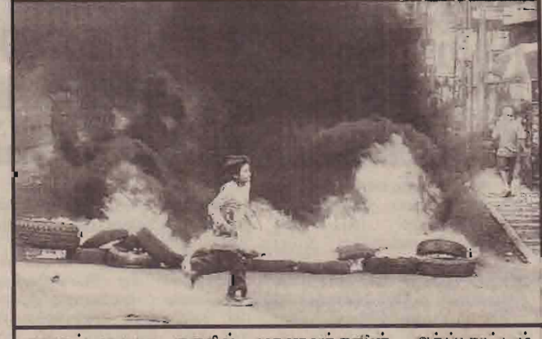
குவாட்ராலா நகரில் மாணவர்களின் ஆர்ப்பாட்டம் ஒன்றில் டயர் எரிக்கப்படுவதையும் சிறுவன் ஒருவன் ஓடிச் செல்வதையும் படத்தில் காண்கிறீர்கள்

தென்கொரிய சனாதிபதி நேற்று அமெரிக்கா சென்றுள்ளார். வடகொரியாவில் அணுசக்தி திட்டங்களை தடுத்து நிறுத்தக் கூடியவகையில் அமெரிக்காவுடன் பொதுவான கொள்கைகளை உருவாக்குவதே இவ்விஜயத்தின் நோக்கமாகும். அமெரிக்காவிற்கும் தென்கொரியாவிற்குமிடையேயான உறவுகளில் ஏற்பட்டுள்ள கசப்பை போக்குவது இவ்விஜயத்தின் மற்றைய குறிக்கோள் என செய்திகள் தெரிவிக்கின்றன.