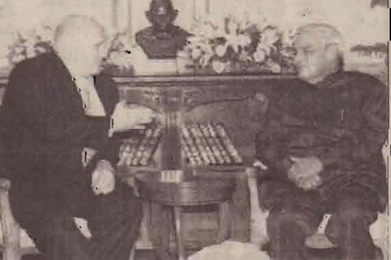
தெற்காசியாவிற்கான விஜயத்தில் இறுதி யாக இந்தியாவில் கால்வைத்த ஆர்மிரேஜ் வாஜ்பாய் உடன் உரையாடுகிறார்.

சராக்கின் பாக்தாத் நகரில் 17 பேருக்கு கொலரா நோய் இடுபுபதாகச் சந்தேகிக்கப்பட்டதையடுத்து, அங்கு கொலரா பரவும் சாத்தியம் உள்ளதாக உலக சுகாதார நிறுவனம் எச்சரிக்கை விடுத்துள்ளது. சராக்கியில் தண்ணீர் விநியோகம் சுகாதார அமைப்புக்களில் ஏற்பட்ட சீர்கேடுகள் தான் இதற்குக் காரணம் என்று மருத்துவர்கள் கூறுகின்றனர். மேலும் நிலவும் நிலைமை களை எதிர்கொள்ள மருத்துவ மனைகளில் போதிய வசதிகள் இல்லை என்றும் கூறப்படுகின்றது.