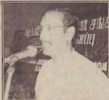
விடுதலைப்புலிகளின் ஆயுதப் படையில் இணைய வேண்டும் இதுவே எமது மக்களைப் பாதுகாக்க ஒரே வழி என்றார்.

விடுதலைப்புலிகள் தமது இராணுவ பலத்தை அதிகரிக்க வேண்டும். இதுவே இந்த நாட்டில் எமது உரிமைகளை உறுதிப்படுத்த ஒரே வழி, யுத்தம் மீண்டும் எம்மது திணிக்கப்படுமானால் ஒவ்வொரு தமிழனும் எதுவித வேறுபாடுமின்றி