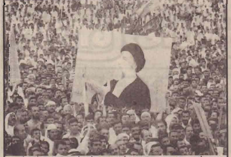
சராக்கின் பாரிய முஸ்லிம் குழுவின் தலைவரான அய்துல்லா - முகமத் பகீர் அல்லஹ்கிம் உரையாற்றும் கூட்டத்தில் அவரின் உருவப்படத்தை ஏந்தி நிற்கும் சராக்கியர்.

தமிழகத்தின் நாமக்கல் மாவட்டம் திருச்செங்குடு நகராட்சிப் பகுதியில் பிளாஸ்டிக் கழிவுகளைப் பயன்படுத்தி தாள் சாலை அமைக்கும் பணி நேற்று முன்தினம் ஆரம்பமாகியுள்ளது. சுகாதார சீர்கேடுகளை விளைவிக்கும் பிளாஸ்டிக் கழிவுகளில் இருந்து தாள் சாலை அமைக்கும் முறை கண்டுபிடிக்கப்பட்டு தற்போது செயற்படுத்தப்பட்டு வருகின்றது. அதன் படி பிளாஸ்டிக் பொருட்களை சேகரித்து அதில் தாள் கலந்து வீதிகளில் போடப்படுகின்றன. சாதாரண வீதிகளுக்கு 06 வருட உத்தரவாதம்தான் அளிக்க முடியும். ஆனால் பிளாஸ்டிக் வீதிகள் 10 வருடங்கள் வரை சேதாரம் இன்றி இருக்கும் என்று கூறப்படுகின்றது.