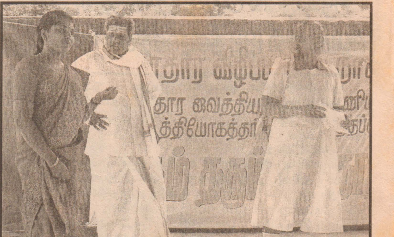
அம்பலவன் வெக்கணை பகுதியில் 22.06.2005 அன்று இடம் பெற்ற இந் நாடகத்தின் ஒரு காட்சியை படத்தில் காண்கின்றீர்கள்