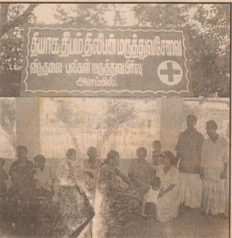
மண்டபத்தில் நியாய் திட்டத்தின் படி உத்தரவுசேவை நேற்றைய தினம் முன்றாம் ஆண்டினை தொடர்ந்துள்ளது. மேலும் முத்துவிநாயக சேவையில் சிகிச்சை மேற்கொள்ள வசூலை வழங்க நடமாடும் நோயாளிகளை படத்தில் காணலாம்.