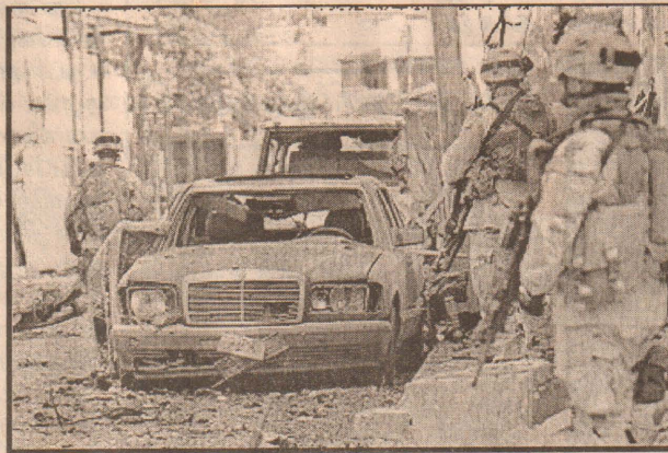
பாக்தாத்தில் கார்க்குண்டுத் தாக்குதல் இடம்பெற்ற பகுதியில் சமீபத்தில் படைப்பினர் காண்புகளில் ஈடுபட்டுள்ளனர். இத் தாக்குதலில் ஆகக் குறைந்தது 17 பேர் கொல்லப்பட்டனர்.

ஈராக்கில் நேற்றுமுன்தினம் மூன்று இடங்களில் கார்க்குண்டு வெடித்ததில் 18 பேர் பலியாகினர். 48 பேர் படுகாயமடைந்தனர். ஈராக் மீது அமெரிக்க கூட்டணி படகுகள் போர் தொடுத்து சதாம் அட்சியை வீழ்த்தியபின் அங்கு கார்க்குண்டு வெடிப்புகள் தொடர்கதையாகிவிட்டன. சதாம் ஆதரவு கெரில்லாக்கள் நடத்தும் தற்கொலை படைத்தாக்குதலால் ஆயிரக்கணக்கானவர்கள் பலியாகிவருகின்றனர். பாக்தாத்தில் ஷியா முஸ்லிம் கள் அதிகம் வசிக்கும் பகுதியில் உள்ள உணவு விடுதி, வாகன பட்டறை உள்ளிட்ட மூன்று இடங்களில் நேற்று முன்தினம் சக்திவாய்ந்த குண்டு வெடித்ததில் 18 பேர் பலியாயினர். 48 பேர் படுகாயமடைந்தனர்.