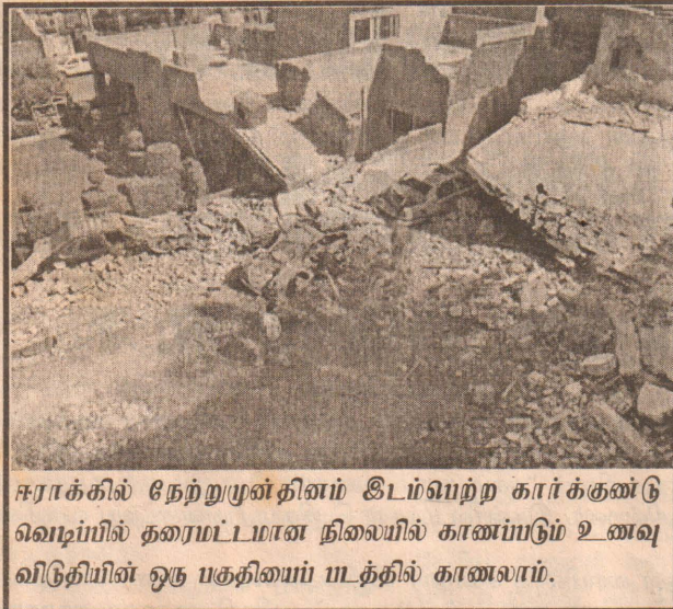
ஈராக்கில் நேற்றுமுன்தினம் இடம்பெற்ற கார்க்குண்டு வெடிப்பில் தரைமட்டமான நிலையில் காணப்படும் உணவு விடுதியின் ஒரு பகுதியைப் படத்தில் காணலாம்.

ஈராக்கிலிருந்து அமெரிக்க இராணுவம் விலக திகதி குறிப்பிடப்படவில்லை என அமெரிக்கா தெரிவித்துள்ளதையடுத்து ஈராக் பிரதமர் இப்ராகிம் அல்-ஜபாரி அமெரிக்க அதிபர் புஷ்சை வெள்ளைமாளிகையில் சந்தித்துப் பேச்சு நடத்தவிருப்பதாகக் கூறப்படுகிறது. அமெரிக்கா அங்கிருந்து வெளியேறினால் நாடு பயங்கரவாதிகளின் கைகளில் சென்றுவிடும் என்றும் அவர் தெரிவித்துள்ளார். அமெரிக்காவுக்கு மட்டுமன்றி சிரியாவுக்கும் ஜபாரி பயணம் செய்ய எண்ணியிருப்பதாகத் தெரிவிக்கப்படுகிறது. இதற்கு அமெரிக்கா, ஈராக் மேலும் வெளிநாட்டுத் துருப்புக்களை தனது நாட்டுக்குள் அனுமதிப்பதாக அமெரிக்கா குற்றம் சாட்டுவதை தெளிவுபடுத்துவதே என்றும் அவர் தெரிவித்துள்ளார். மேலும் அவர் தெரிவிக்கும் போது; அமெரிக்கா ஈராண்டன் அணுவாயுதக்கொள்கையை வைத்திருப்பினும் பாக்தாத் எப் போதும் நல்லுறவை கொண்டிருக்கும் என்றும் தெரிவித்துள்ளார்.