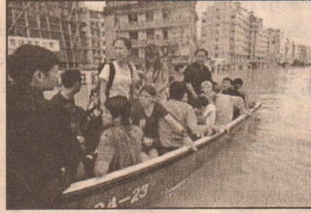
காண்பித்து வருகிறது. தென்சீனாவில் வெள்ளம் காரணமாக பொருளாதாரத்தில் 11 மில்லியன் யென் இழப்பு ஏற்பட்டுள்ளதாகவும் தெரிவிக்கப்படுகின்றது.

ஸ்தாபனம் தெரிவித்துள்ளது. இதன் காரணமாக ஆறு மாகாணங்களில் இருந்து 14 இலட்சம் மக்கள் இடம் பெயர்ந்துள்ளனர். வெள்ளம் கிராமங்களை அடித்துச் செல்வதையும், மீட்புப் பணியாளர்கள், சிறுவர்களை மீட்டெடுக்கும் காட்சிகளையும் அரசு தொலைக்காட்சி