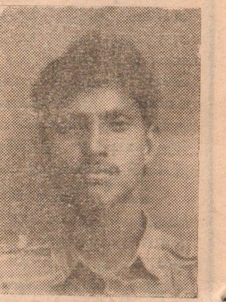
2-ம் லெப். தவம்