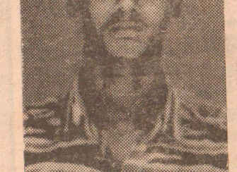
2-ம் லெப். இசையாளன்

வட்டபு பரிசோதகர். அவர் ஐ. தே. கவின் 17 வருட கால நண்பர். தோட்டத் தொழிலாளரின் நலனுக்காக அவர் பதவிக்குவரும் எந்த அரசையும் பகைத்துக்கொள்ள விரும்பவில்லை.