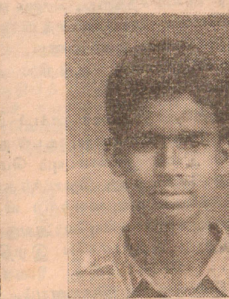
வீரவேங்கை தவரதன் [தவச்செல்வன்]

15-09-1994 அன்று மட்டக்களப்பு மாவட்டம் நெடுஞ்சேனைப் பகுதியில் சிறிலங்கா இராணுவத்தினருடனான நேரடி மோதலில் 8 போராளிகள் வீரச்சாவடைந்தனர். இவர்களுக்கு தமிழீழ விடுதலைப் புலிகள் வீரவணக்கம் செலுத்துகின்றனர்.