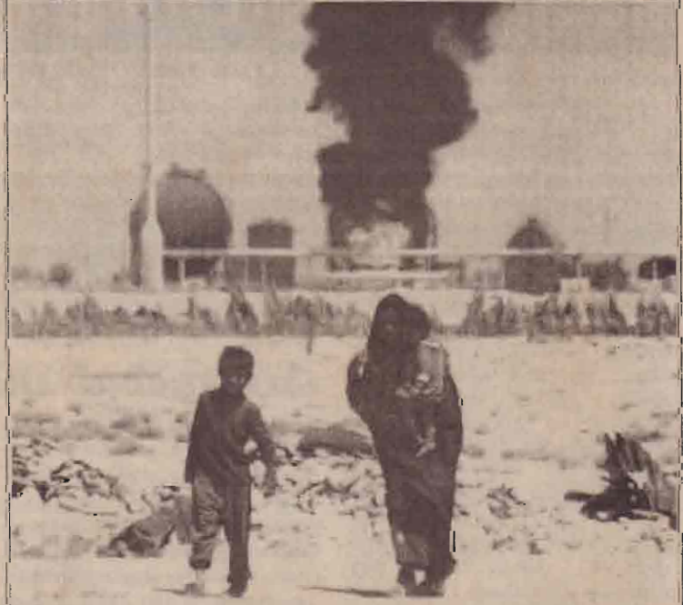
பஸ்ராவுக்கு அருகேயுள்ள அம்-சபால் எரிபொருள் களஞ்சியம் தீப்பற்றி எரிகையில் அம்பால் விரைவாகச் செல்லும் உள்ளூர் வாசிகள்.

குட! (சன்பரா) ஆறு வெளிநாட்டு தீவிரவாத அமைப்புகளுக்கு அவுஸ்திரேலியாவில் செயற்படத் தடை விதிக்கப்பட்டுள்ளது. லஷ்கர்-இஜாஹி ஜெய்ஷ்-இ-முஹம்மது உள்ளிட்ட ஆறு தீவிரவாத அமைப்புகளுக்கே அவுஸ்திரேலிய அரசு தடை விதித்துள்ளது.