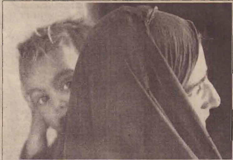
செளவ்பான் வைத்தியசாலையில் உள்ளூர் வைத்தியரைச் சந்திக்க தனது மகளுடன் காத்திருக்கும் ஈராக்கிய பெண்மணி

கடமைக்குத் திரும்பும் பொலிசாரும் சதாமின் ஆதரவாளர்களா? என்ற புரண விசாரணையின் பின்னரே கடமைக்கு அனுமதிக்கப்படுகின்றனர்.