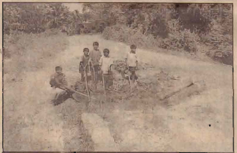
கரமும் போக்கு - உருத்திரபுரம் வீதியின் நடுவில் பெரிய குழி. அதில் விளையாடும் சிறுவர்கள் (மடம் சோதி)

மேற்படி திட்டங்கள் முன்னிறுத்தப்பட்டு சிரான் பணிப்பாளரிடம் கையளிக்கப்பட்டது. (சோ)