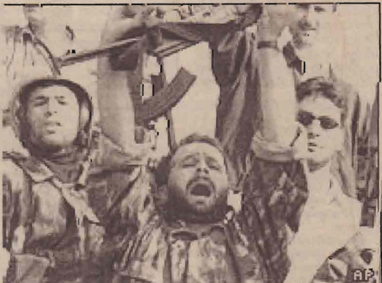
ஹர்ஸ்புல்லா இயக்க ஆதரவாளர்கள் சிரியாவுக்கு ஆதரவாகக் கோசுமொழியூச்சுள்ளனர்.

திகதிகளில் சனாதிபதி புஷ்வின் பணியகத்தில் இடம்பெறும் என்று வெள்ளை மாளிகை அறிவித்துள்ளது.