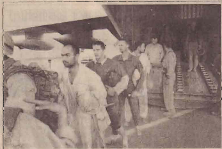
மீட்கப்பட்ட போர்க் கைதிகளான அமெரிக்கப் படையினர் ஏழு பேர் குவைத்திற்கு அழைத்துச் செல்லப்படுகின்றனர்.