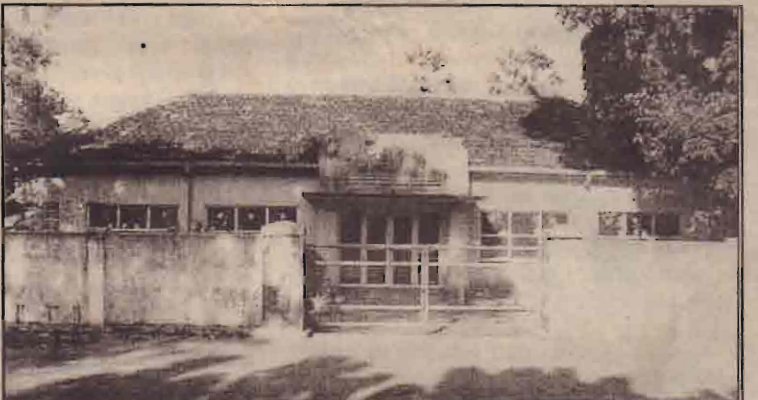
1950 ஆம் ஆண்டு அமைக்கப்பட்ட வைத்திய சாலை எதுவித புனரமைப்புக்களும் இல்லாமல் இப்பகுதியில் காணலாம்.

முறக்கொட்டாஞ்சேனை, சந்தி தகல், கோராவெளி, தரவை வெளி, கிரான்,கோரக்கல்லிமடு, ஆகிய பகுதி மக்கள் திகிலிவெட்டை, புலிபாய்ந பயன்படுத்தி வருகின்றனர்.