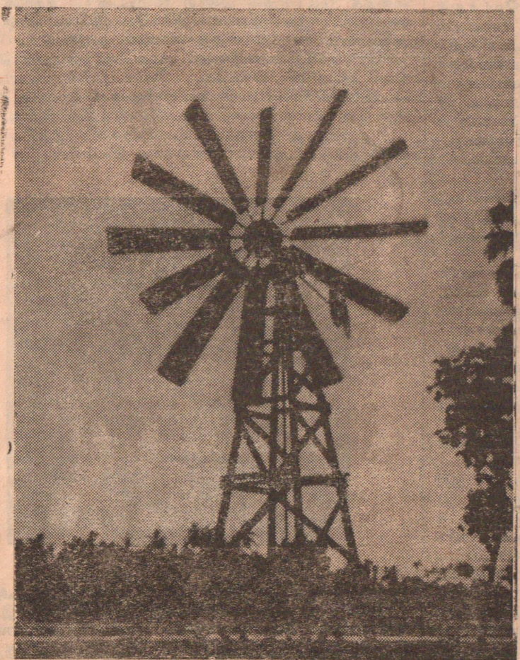
இப்பொழுது திருநெல்வேலி விவசாய ஆராய்ச்சி நிலையத்திலும், கந்தரோடை பிரதான வீதியிலும் இவை இயங்கிக் கொண்டிருக்கின்றன.

“எரிபொருட் தடையை இனிக்காற்றாமை உடைக்கும், நீரிறைக்கும், மின்வழங்கும் - புதியயுகம் படைக்கும்”