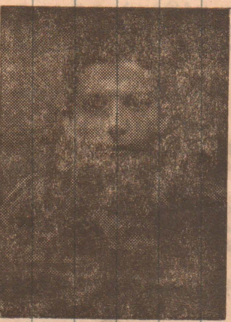
2-ம் லெப் முத்து (அசுந்தன்)

மணலாறு மண்ணில் கணநேரமும் ஓயாது மாவீரர் ஆணீர்கள் களத்தில் நும்பணி தொடரும்