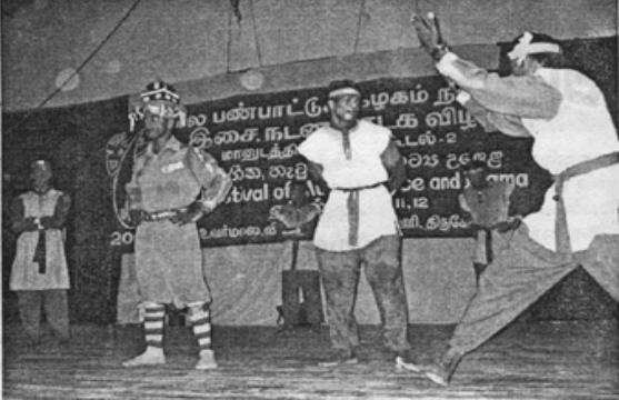
கேற்றப்பெற்றது. கிரண்டாம் நான்கு நக்சுச்சியாக தர்மசீர்த் பண்பாட்டாய்க் கொண்டுவரப்பட்டது...