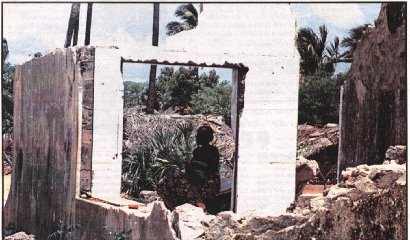
தமிழீழ விடுதலைப்புலிகளின் அதிகாரபூர்வ ஏடு

அத்தகைய செயற்திறனுள்ள கடற்புலிகள் இன்று சமாதானக் (02ம் பக்கம் பார்க்க)