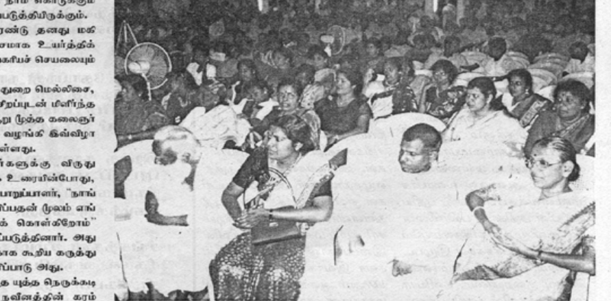
தந்தையே தல்லெண்ண சமீகங்களை விவரிக்கும்பொழுது அவசியம். கிதமன பார்வை, கிளையான பேச்சு, வசீகரமான பார்க்கை, நம்பிக்கை...