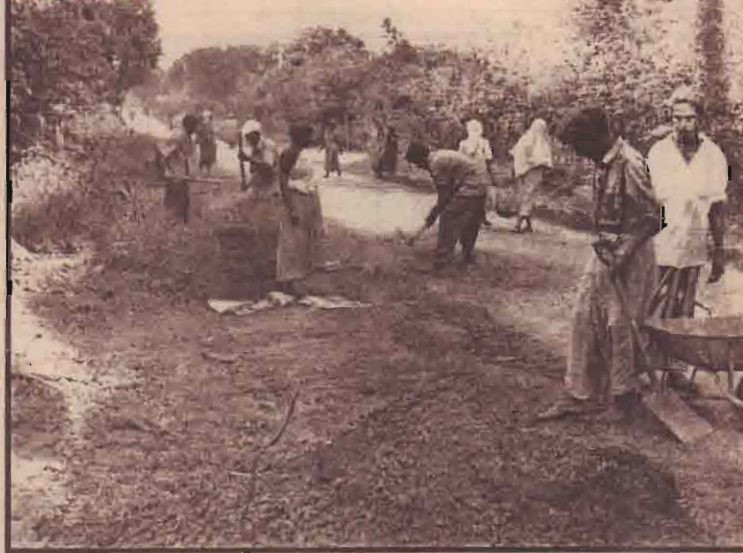
கிளிநொச்சி மாவட்ட துயிலும் இல்லம் வரையான டிப்போ வீதியின தார்போட்டு அகலமாக்கும் பணிகள் தற்போது இடம் பெற்று வருகின்றன. மக்கள் போக்குவரத்து கூடிய வீதியென்பதால் இப்பணிகள் ஆரம்பிக்கப்பட்டுள்ளன.

கடந்த நாளும் திகிலை ஐயத்து கருத்தரங்குகள் நடைபெற்றுள்ளன. இதில் ஐயாயிரத்திற்கும் மேற்பட்ட மக்கள் கலந்து பயன்பெற்றமை குறிப்பிடத்தக்கது. (சோ)