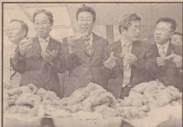
பறவைக்காய்ச்சல் நீதிபால் தென் கொரியாவில் கோழிநூல்தீர் வித்பனை பெரு வீழ்ச்சியைக் கண்டிருக்கும் நிலையில் நீண்டும் கோழி நூல்தீர்ச்சிக்கான கேள்வியை அங்கீகரிக்கும் நோக்கில் பல உத்திகள் உயர்ப்பாட்டு வகுக்கின்றன. இங்கே தென்கொரிய உணவு விடுதி ஒன்றில் கோழிக்கறையைப் பல விதங்களில் சமைத்து ரு பார்த்துள்ள மருத்துவர்கள்.