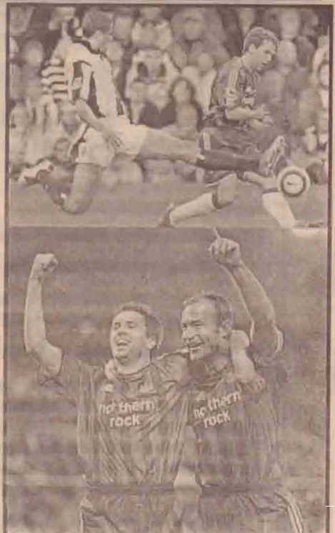
ஐரோப்பாவில் நடைபெறும் பிரிடயர் ஷிப் கால்பந்துப் போட்டியில் 3-0 என்று கோல் கணக்கில் வெஸ்ட்ஹாம் அணிவது வென்ற நியூகாஸல் உதைபந்தாட்ட வீரர் எம்க்கல் ஓவன் வெஸ்ட்ஹாம் வீரர் ஷோலா அபிடியோபியை மீறி கோல் அடிக்கும் காட்சியை முதலாவது படத்திலும் மகிழ்ச்சியை கொண்டாடுவதை இரண்டாவது படத்திலும் காணலாம்.