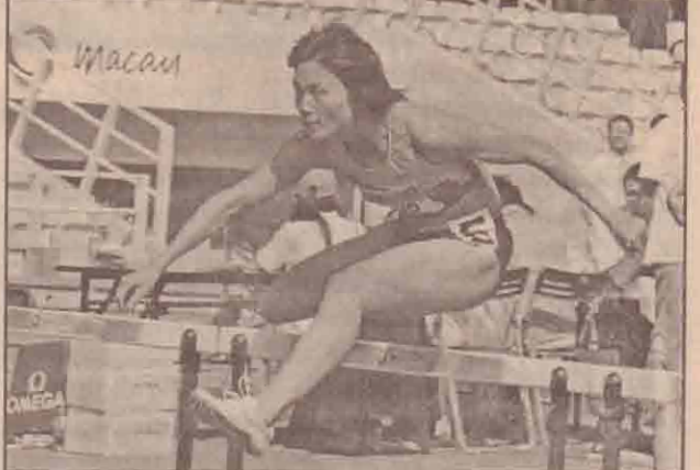
இங்கே பெண் புலி போல் தாவி பாய்கிறவர் சீனாவைச் சேர்ந்த ஓட்டப்பந்தய வீராங்கனை பெங்யுன் கிமுக்கு ஆசிய கேம்ஸ் மக்காஸ்தான் நடைபெற்று வருகிறது அதில் நேற்று முன்தினம் 100 மீற்றர் ஹேர்டிஸ் போட்டியில் பெங்யுன் தங்கப்பதக்கம் வென்றார்.

இந்தியா- இலங்கை அணிகள் மோதும் ஒருநாள் தொடரின் ஐந்தாவது போட்டி அகமதாபாத்தில் இன்று பகல்-இரவு போட்டியாக நடைபெறுகின்றது. டில்லி குண்டு வெடிப்பு சம்பவத்தை தொடர்ந்து இப்போட்டிக்கு பலத்த பாதுகாப்பு ஏற்பாடுகள் செய்யப்பட்டுள்ளன. நகரெங்கிலும் பொலிசார் குவிக்கப்பட்டுள்ளனர். இந்தியா சென்றுள்ள இலங்கை கிரிக்கெட் அணி ஏழு போட்டிகளிலும் கொண்ட ஒருநாள் தொடரில் விளையாடுகிறது. முதல் நான்கு போட்டிகளிலும் இந்திய அணி அட்டகாசமாக விளையாடி 4-0 என்ற முன்னிலையில் தொடரை கைப்பற்றிவிட்டது. பெரிய எதிர்பார்ப்பு இல்லாத ஐந்தாவது போட்டி இன்று அமதாபாத்தில் நடக்கிறது. இருபினும் எஞ்சிய போட்டியிலாவது வெற்றி பெற்று தனது கௌரவத்தை காப்பற்றிக் கொள்ள சிறிலங்கா அணி முயற்சிக்கும் என எதிர்பார்ப்பதால் இப்போட்டியும் பரபரப்பு நிறைந்ததாகவே காணப்படும் என எதிர்பார்க்கப்படுகிறது.