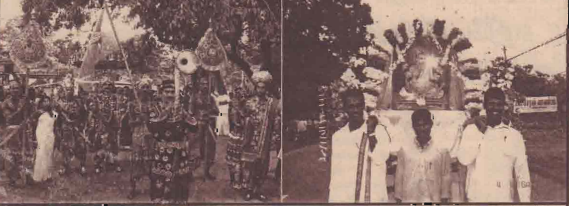
திருவள்ளூர் விழாவையொட்டி நேற்று முன்தினம் கிளிநொச்சியில் நடைபெற்ற பண்பாட்டுப் பேரணியில் கலந்துகொண்ட தமிழ் மன்னர்களின் அணிவகுப்பையும் திருவள்ளூரின் உருவப்படம் தாயகிய பணியையும் படத்தில் காணலாம்.

அப்பாற்ற அலுவலகமேயுப் பிரதேச செயலகத்திற்குட்பட்ட கூட்டுறவுச் சங்கத்தில் களஞ்சியப்படுத்தப்பட்டிருந்த காலாவதியான 616 மூடைகளை மாற்றி கொச்சிசுகாதார சேவை அதிகாரிகளால் உண்டுபடுத்தப்பட்டு அழிக்கப்பட்டுள்ளன. களஞ்சியப் பாதிக்கப்பட்ட மக்களுக்கு வழங்குவதற்காகவே இவ்வாறு களஞ்சியப்படுத்தப்பட்டிருந்ததாகத் தெரிவிக்கப்படுகிறது.