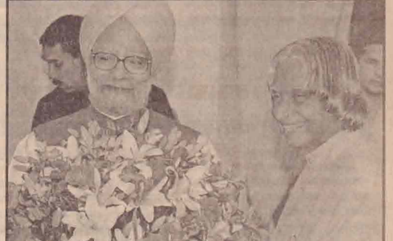
நேற்று முன்தினம் இடம்பெற்ற ரம்ஜான் பண்டிகையை முன்னிட்டு இந்தியக் குடியரசுத் தலைவர் அப்துல்கலாம்ந்ரு மலர்ச் செண்டு கொடுத்து வாழ்த்துத் தெரிவிக்கின்றார் பிரதமர் மன்மோகன்சிங்.