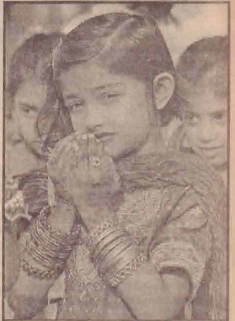
ரம்ஜான் பண்டிகையை முன்னிட்டு பூவம் பந்தால் பஸிபாளவர்களுக்காக பாகிஸ்தானில் சிறப்புப் பிரார்த்தனை இடம்பெற்றது. தீய் பிரார்த்தனையில் தம் நேறலுபோல உறவுகளுக்காக பிரார்த்திக்கும் பாகிஸ்தான்காரர்.

தமது உரிமையை வலியுறுத்தியே அவ் இளைஞர்கள் கலவரங்களில் ஈடுபடுவதாகச் சொல்லப்பட்டாலும், இக் கலவரத்தின் பின்னணியில் போதைப் பொருட்கும்பல்கள் இருப்பதாக பிரான்ஸ் அரசு தெரிவிக்கின்றது.