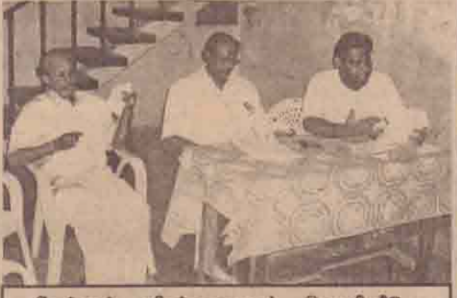
தேர்தல் விஞ்ஞாபனம் வெளியீடு

* தமிழீழ விடுதலைப்புலிகளின் தலைமையை தமிழ்மக்களின் தேசியத் தலைமையாகவும், வி.புலிகளை தமிழ் மக்களின் உண்மையான ஏக பிரதிநிதி களாகவும் ஏற்றுக்கொண்டுள்ளதாகத் தெரிவித்து தமிழ்த் தேசியக் கூட்டமைப்பு தேர்தல் விஞ்ஞாபனத்தை வெளியிட்டது.