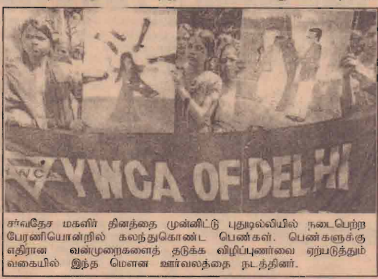
சர்வதேச மகளிர் தினத்தை முன்னிட்டு புதுடில்லியில் நடைபெற்ற பேரணியொன்றில் கலந்துகொண்ட பெண்கள். பெண்களுக்கு எதிரான வன்முறைகளைத் தடுக்க விழிப்புணர்வை ஏற்படுத்தும் வகையில் இந்த மௌன ஊர்வலத்தை நடத்தினர்.

இறுதியில் யானையை வெற்றி யீட்டியதாக அறிவிக்கப்பட்டது. இந்த பூரித்திருவிழாவில் கடந்த நான்கு ஆண்டுகளாக இதேயானை தொடர்ந்து வெற்றியீட்டியுள்ளது என்பது குறிப்பிடத்தக்கது.