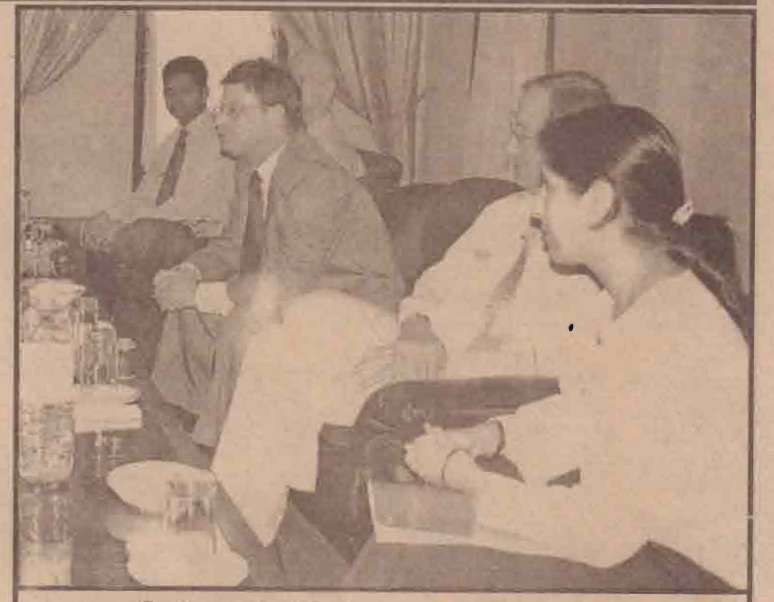
நேற்று இடம்பெற்ற சந்திப்பின்போது...

திப்பில் முக்கியமாக நாம் தமிழ்நாடு தாயகப் பிரதேசத்தில் நாம் தொடர்ச்சியாக மேற்கொண்டு வரும் அபிவிருத்தி நடவடிக்கைகள் அவசர மனிதாபிமானப் பணிகளை முன்னெடுப்பதற்கான தேவைகள் சம்பந்தமாக நாம் கூடுதலாக (8ஆம் பக்கம் பார்க்க)