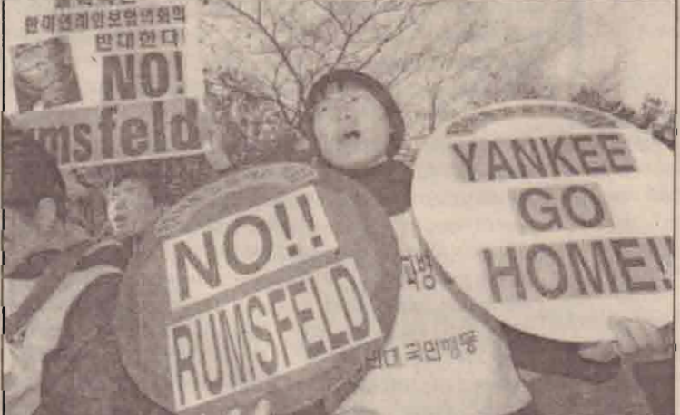
தென்கொரியாவுக்கு விஜயம் மேற்கொண்டுள்ள அமெரிக்கப் பாதுகாப்பு சமையச்சர் டொனால்ட் ரம்ஸ்பீல்ட் சீமாவில் உள்ள சேலிய மயானம் ஒன்றுக்கு விஜயம் செய்த போது அங்கு ஆர்ப்பாட்டத்தில் ஈடுபடும் ஆர்ப்பாட்டக்காரர்கள்.