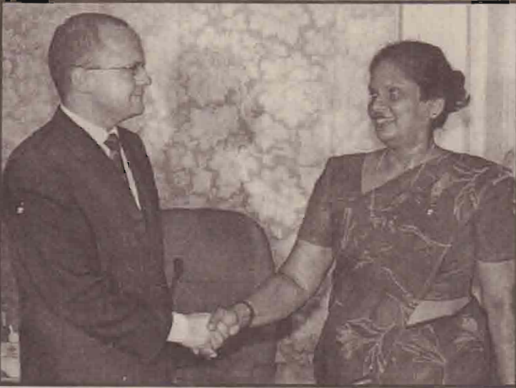
நோர்வே தமது பணிகளை இடைநிறுத்தி விட்டு வெளியேற வேண்டிய நிலைக்கு உள்ளாகியது.

அதாவது மீண்டும் ஒரு பொதுத் தேர்தலில் சமாதானத் தீர்வை முன்னிறுத்தி ஐ.தே.முன்னணி மூன்றில் இரண்டு பங்கு பெரும்பான்மையுடன் ஆட்சி அதிகாரத்திற்கு வராதவிடத்து அன்றி சமாதானத்தை வலியுறுத்தி சனாதிபதித் தேர்தலில் ரணில் விக்கிரமசிங்க வெற்றி பெறாத வரையில் இலங்கையில் சமாதான முயற்சிகள் குறித்து எவரும் திருப்திப்பட்டுக்கொள்ளத்தக்க வகையில் முன்னேற்றங்கள் எட்டப்படுதல் என்பது கடினமாகவே இருக்கும். அவ்வேளையிலும் கூட ஆட்சியாளர்கள் குறிப்பாக, ரணில் இனப்பிரச்சினைக் குத் தீர்வுகாண உள்பூர்வமாக ஈடுபாடு காட்டுதல் வேண்டும்.