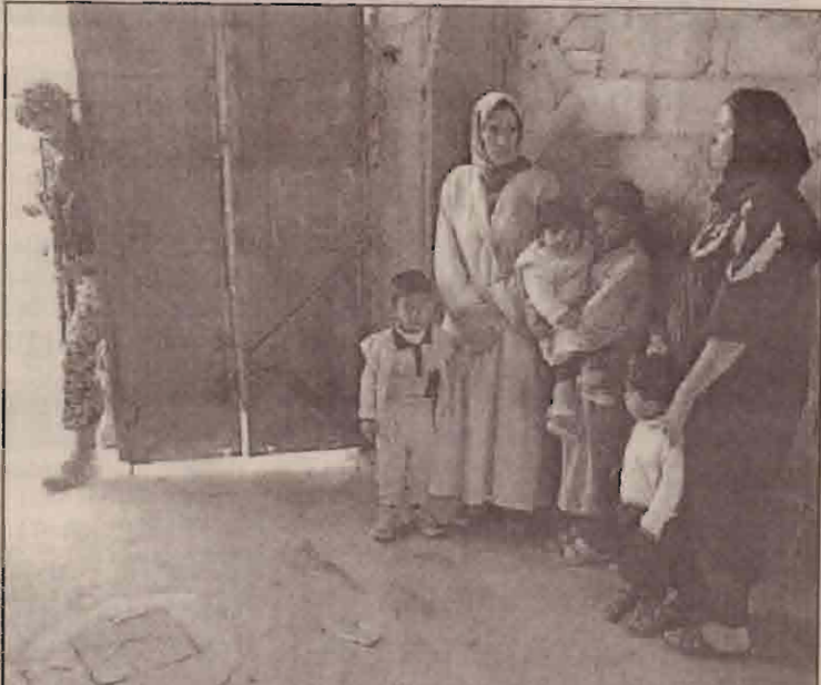
பக்தாத்தின் அதினாத்து வரும் கருங்குழத் தாக்குதல்களையடுத்து சேலுதல் நடவடிக்கையில் ஈடுபட்டுள்ள ஈராக்கியப் பொலீசார் ஒருவர் குடும்பம் ஒன்றைக் கூர்ந்து அவதானிக்கின்றார்.

கெரில்லாக்கள் மறைந்திருந்த முகாமொன்றை நோக்கியே படை நடவடிக்கை ஆரம்பிக்கப்பட்டதாக அமெரிக்க படைத்தரப்பு செய்தி வெளியிட்டுள்ளது. ரிக்ரீட் நகரம் பாக்தாத்திற்கு வடக்கே 180 கிலோமீட்டர் தூரத்தில் உள்ளது. அமெரிக்கப் படையினரின் இவ்வாறான தாக்குதல்களால் பொதுமக்களுக்குப் பெரும் இழப்புகள் ஏற்படும் அபாயம் ஏற்பட்டுள்ளதாக அச்சம் தெரிவிக்கப்பட்டுள்ளது. மேலும், சன்னி முஸ்லிம்கள் அதிகமாக வாழும் பகுதிகளில் அமைந்துள்ள சுமார் 450 வீடுகளில் அமெரிக்கப் படையினர் கடுமையான தேடுதல் நடவடிக்கைகளை மேற்கொண்டதாகவும் அறிவிக்கப்பட்டுள்ளது. படை நடவடிக்கையில் தீவிர ஆயுதப் பிரவேசம் கெரில்லாக்களின் தாக்குதல்களைக் கட்டுப்படுத்தும் என அமெரிக்கப் படையினர் நம்புவதாகக் கூறப்படுகிறது.