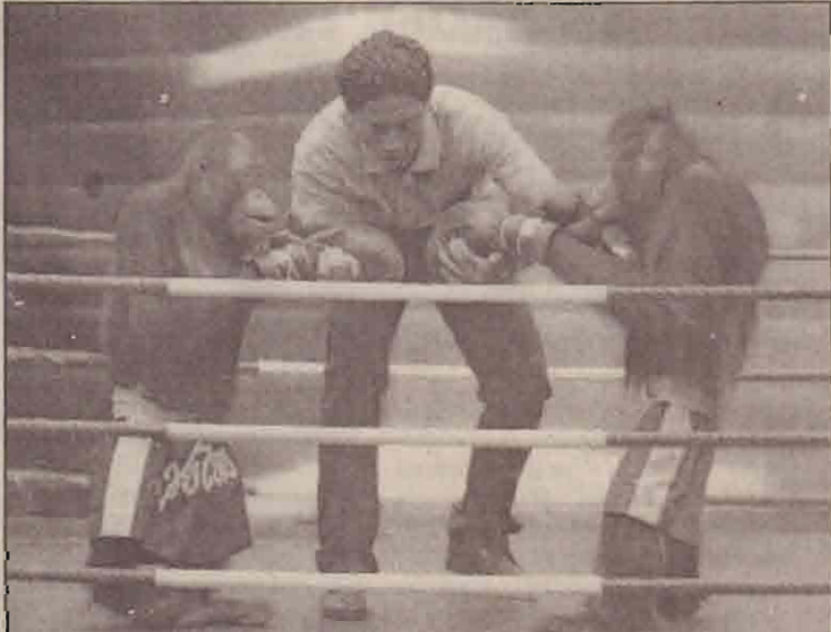
உலகின் முதுவாழ்வும் எங்குமில்லாததுமான கத்தக் சன்னிடம் போட்டிக்கு ஆயத்தமாகும் உராம்துடன் இன வாசலிலாக் குழங்குகள். பங்களிப்பில் ஈடுபட்ட ஐ.நா.சபை.

இடைக்கால அரசாங்கத்திடம் ஒப்படைப்பது தொடர்பாக எவ்வாறு பங்களிக்கலாம் என்பது பற்றி அவர் ஆராய்ந்து வருவதாகத் தெரிய வருகிறது.