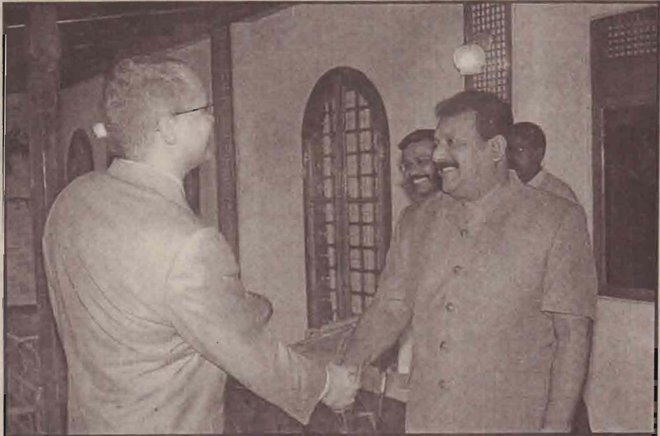
தெளிவாகவும், உறுதியாகவும் தெரிவித்திருந்தார்.

அத்தோடு, "சமாதானப் பேச்சுவார்த்தைகளில் நாம் ஆர்வத்துடனும், உறுதிப்பாட்டுடனும் இருக்கின்றோம்" எனவும் விடுதலைப்புலிகளின் நிலைப்பாட்டைத் தெளிவாகவே எடுத்துக் கூறியிருந்தார். விடுதலைப்புலிகளின் இந்நிலைப்பாடானது அவர்கள் யுத்த நிறுத்தம் தொடர்பாகவும், சமாதானப் பேச்சுவார்த்தைகள் தொடர்பாகவும் தெளிவானதொரு நிலைப்பாட்டைக் கொண்டுள்ளனர் என்பதை உலகிற்கு அறிவிப்புச்செய்வதாக இருந்தது.