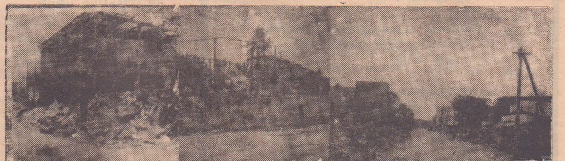
வீமானம் குண்டுவீச்சால் அழிந்த வெலிங்டன் திரையரங்கும், மயான அமைதி நிலவும் ஸ்ரான்லி வீதியும்.

சொறிகல்முனை என்ற கிராமத்தைச் சுற்றிவளைத்த இராணுவத்தினரும், முஸ்லிம் ஊர்காவற்படையினரும் 35 தமிழ் இளைஞர்களைக் கொலை செய்து சவளக்கடை இராணுவ முகாமிற்கு அழைத்துச் சென்று அங்கு அவர்களைச் சுட்டுக் கொலை செய்தனர். (க)