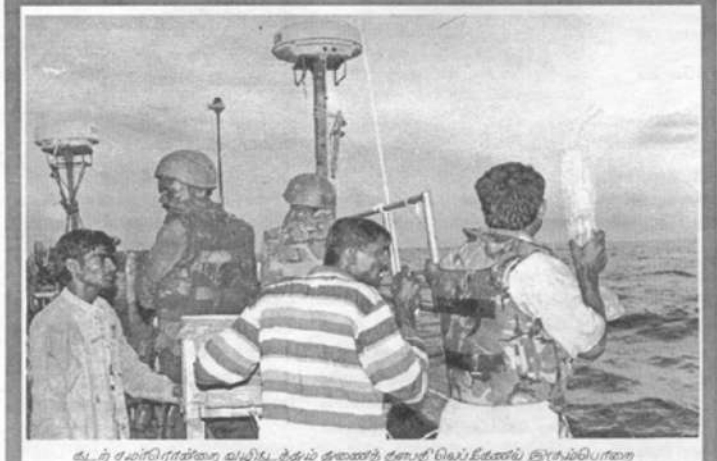
கடற் சமீரொன்றை வழிநடத்தும் துணைத் தளபதி வெல் கேசன் சூழும்பொறை

ஆழக்கடலைக்கூட அளக்க நேர்டலாம். என்னும் நிலக்கடலின் வீரப்புலிகளின் ஈக்கனையும் சோகக்கனையும் யாராலும் அளக்க முடியாது.