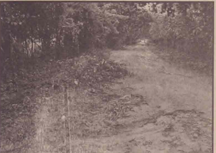
உருத்திரபுரம் எட்டாம் வாய்க்கால் பகுதியில் காணி வேலிக் கழிவுகளை வடிக்காவில் கொட்டியுள்ளதன் காரணமாக மழைநீர்வளம் வீதியை மேலும் பாப்பதனால் வீதிசேதமடைந்துள்ள தளையம்மத்தில் காணலாம். (மடம்-சோதி)

இன்று திங்கட்கிழமை நெடுங்கேணி பாடசாலையில் பற்சிக்ச்சை நடைபெறவுள்ளது. இதில் பல்பிடுங்குதல், பல்சுத்தம் செய்தல், பல் அடைத்தல் போன்றவற்றுடன் பற்க்காதாரம் சம்பந்தமான அறிவுரைகளும் வழங்கப்படவுள்ளன. இதில் கலந்து கொண்டு அனைவரும் பயன்பெறுமாறு தியாக தீயம் தில்பன் மருத்துவ சேவையினர் கேட்டுள்ளனர். (த)