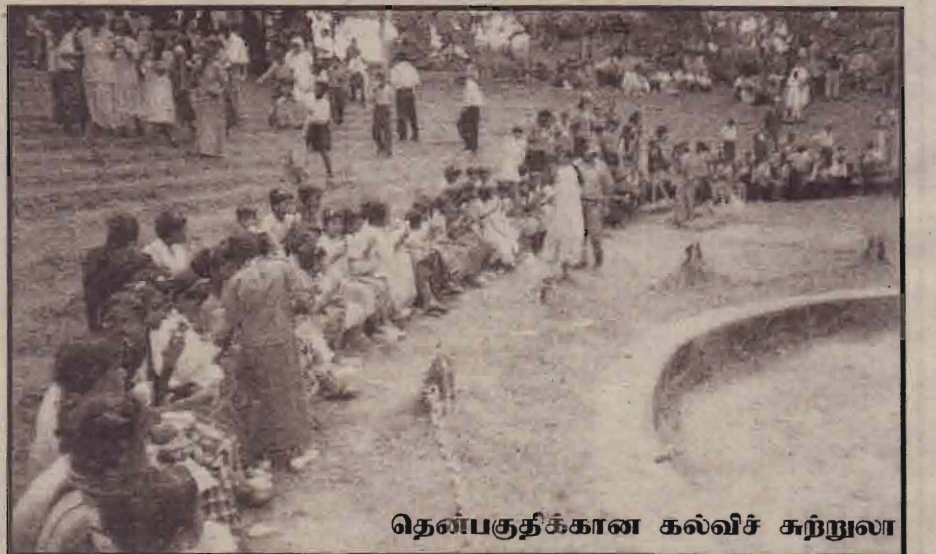
தென்பகுதிக்கான கல்விச் சுற்றுலா

ஒரு பிள்ளைக்கான ஒருநாள் உணவுத்தேவைக்காக 87 ரூபா செலவாகும். இங்கு பராமரிக்கப்படுகின்ற சிறுவர்