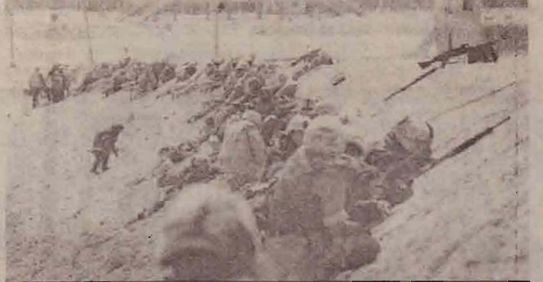
அமெரிக்காவின் 15வது அதிரடிப் படைப்பிரிவு வீரர்கள் ஈராக்கிய வீரர்களுடன் நரைத்தாக்குதலில் ஈடுபடுகின்றனர்