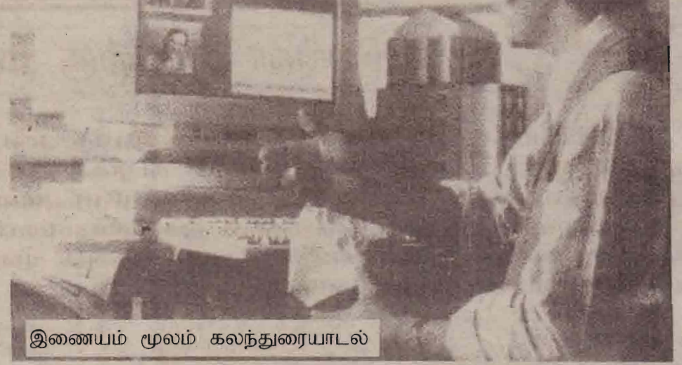
இணையம் மூலம் கலந்துரையாடல்

உறவுகளை அனுப்பிவிட்டுத் தொலைபேசி மூலமே அவர்களுடன் உரையாடல்களை மேற்கொண்டுவரும் எம்மவர்களுக்கு வரப்பிரசாதமாக அமைந்துள்ளது. இந்த இணையத் தொலைபேசியாகும். சாதாரண தொலைபேசிமூலம் உரையாடல் பெருமளவு கட்டணத்தைச் செலுத்த வேண்டியுள்ள நிலையில் இணையத் தொலைபேசி மூலம் குறைந்தளவு கட்டணத்துடன் பேச முடிவது பலரையும் வியப்புக்குள்ளாக்கியுள்ளது.