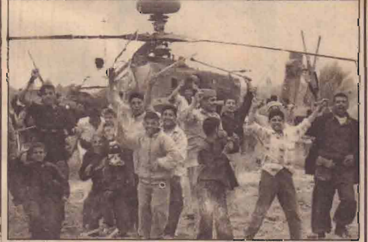
சுட்டு வீழ்த்தப்பட்ட உலங்கு வானூர்திக்குமுன் சமூகக்குதலாளிகளும் சராசரக்கிய மக்களும்.

அமெரிக்க அப்பாச்சே தாக்குதல் உலங்கு வானூர்தியொன்று நேற்று சராசரக்கிய குடியரசு இராணுவத்தால் சுட்டு வீழ்த்தப்பட்டுள்ளது. சராசரக்கின் தலைநகர் பாக்கி தாத்திற்குத் தெற்கே 96 கிலோமீற்றர் தூரத்தில் சராசரக்கியப் (08ஆம் பக்கம் பார்க்க)