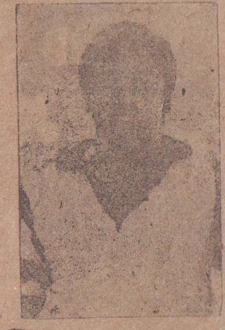
லெப். கேணல் குமரப்பா