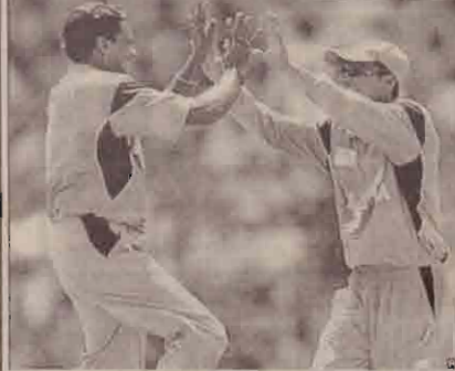
தென்னாபிரிக்கா செஞ்சூரியன் பார்க் மைதானத்தில் நேற்று நிறைவு பெற்ற இந்திய நியூசிலாந்து அணிகளுக்கு கிடையிலான உலகக்கிண்ண இறுதி 'சுப்பர் சிக்ஸ்' போட்டியில் இந்தியா ஏழு விக்கெட்டுக்களால் நியூசிலாந்து அணியைத் தோற்கடித்துள்ளது.

147 ஓட்டங்கள் என்ற வெற்றி இலக்கை நோக்கி துடுப்பெடுத்தாடிய இந்திய அணி 40.4 ஓவர்களில் மூன்று விக்கெட்டுக்களை இழந்து 150 ஓட்டங்களைப் பெற்றதன் மூலம் இவ் வெற்றி பெறப்பட்டது. முன்னதாக நாணயச்சுழற்சியில் வெற்றி பெற்ற இந்தியா நியூசிலாந்தை துடுப்பெடுத்தாட அழைத்தது. இதற்கமைய ஆட்டத்தை ஆரம்பித்த நியூசிலாந்து இந்திய பந்துவீச்சாளர்களுக்கு முகம் கொடுப்பதில் சிரமத்தை எதிர்நோக்கி 45.1 ஓவரில் சகல விக்கெட்டுக்களையும் இழந்து 146 ஓட்டங்களைப் பெற்றது. வேகப்பந்து வீச்சாளர் சகீர்ஹானின், முதலாவது ஓவரின் இரண்டாவது மூன்றாவது பந்து வீச்சில் இரண்டு விக்கெட்டுக்களை இழந்த நியூசிலாந்து அதன் பின் ஓட்டம் பெறுவதில் பின்னடைவு கண்டது. அணித் தலைவர் ஸ்ரீபன் பிளமிங் 30, ஜெக்கப் ஓரம் 23, கிறிஸ்கெயின் 20 ஓட்டங்களை முறையே பெற்று துடுப்பாட்டத்தில் ஓரளவு பிரகாசித்தனர். பந்து வீச்சில் சகீர்ஹான் 42 ஓட்டங்களுக்கு 4விக்கெட்டுக்களை வீழ்த்தி வெற்றிக்கு வழிசமைத்ததுடன் ஆட்டநாயகனாகவும் தெரிவானார். இந்தியா சார்பில் துடுப்பாட்டத்தில் முகமட்டை 68.ராவிட் 55 ஓட்டங்களையும் ஆட்டம் இழக்காது பெற்று வெற்றியை உறுதியாக்கினார். இப்போட்டியில் இந்திய அணி நியூசிலாந்தை தோற்கடித்ததன் மூலம் அவ்வணிக்கான அரையிறுதிப்போட்டிக்கான வாய்ப்பு பெரும்பாலும் அற்றுப் போயுள்ளது. இது இன்றைய சிறிலங்கா, சிம்பாவே போட்டி மூலம் உறுதியாகிவிடும் என எதிர்பார்க்கப்படுகிறது.