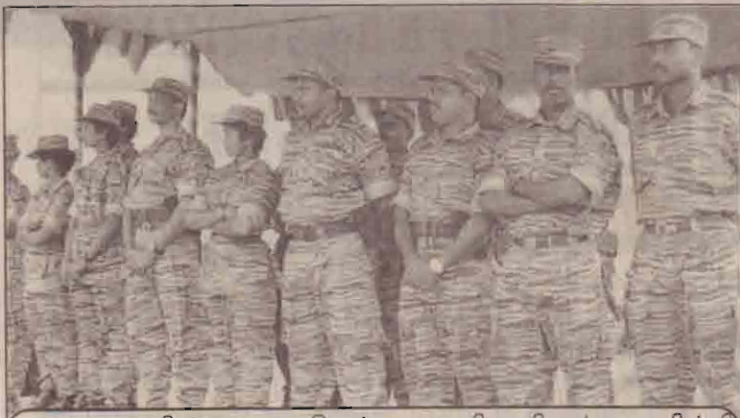
கரடியனாறில் நடைபெற்ற அதிகாரிகள் பயிற்சி பெற்றபோராளிகளுக்கு சான்றிதழ்வழங்கும் நிகழ்வில் தளபதிகள் அணிவகுப்பு மரியாதையினை ஏற்றுக்கொள்கின்றனர்.