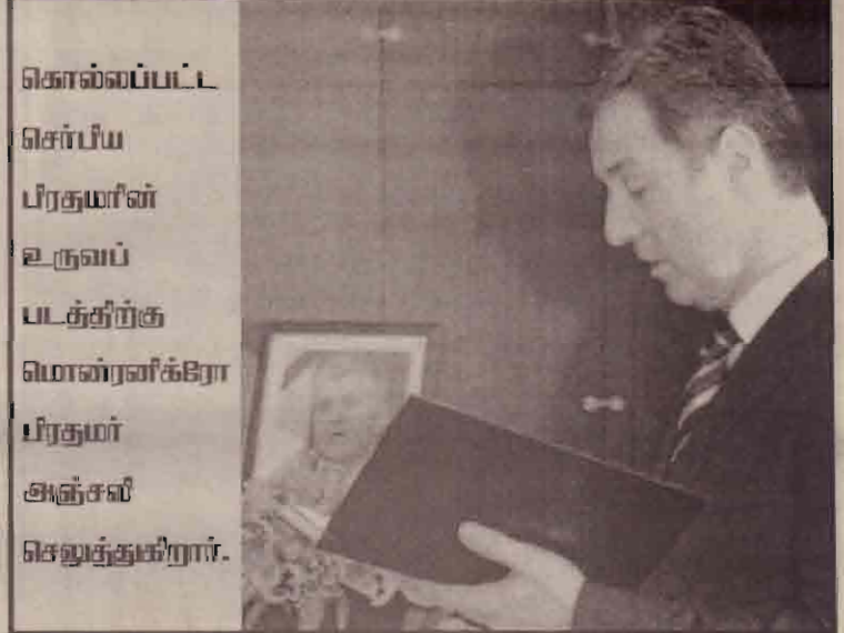
கொல்லப்பட்ட செர்பிய பிரதமரின் உருவப்படத்திற்கு மொன்ரோக்கோ பிரதமர் அஞ்சலி செலுத்துகிறார்.

பதுங்கு குழிகளை அளமக்க கோரிக்கை அமெரிக்காவின் விமானத்தாக்குதல்களிலிருந்து பாதுகாத்துக் கொள்ள பதுங்கு குழிகளை வெட்டுமாறு ஈராக் சனாதிபதி சதாம் ஹுசைன் ஈராக் மக்களுக்கு வேண்டுகோள் விடுத்துள்ளார். ஈராக்கிய கவர்னர்கள், மேயர்கள் மற்றும் அரசாங்க நிர்வாகிகள் ஆகியோருக்கு காண்கூட்டத்தில் கலந்து கொண்டு உரையாற்றும் போதே அவர் ஈராக் மக்களுக்கு இந்த வேண்டுகோளை விடுத்துள்ளார்.