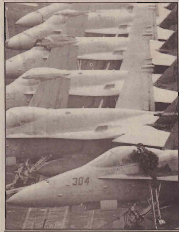
மோட்டாரை சரியாக்கும் குவைத்தில் உள்ள அமெரிக்கப்படைச் சிப்பாயும், விமானப்படை விமானங்களும்.