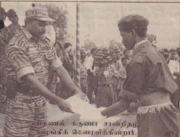
தேனாலு கருணா சான்றிதழ் வழங்கிக் கௌரவிக்கின்றார்.

இதனால் நேற்று முதல் திடீர் விதிச் சோதனைகள், சுற்றிவைத்து சந்தேகத்திற்கு இடமானவர்களை விசாரணைக்கு உட்படுத்துதல் போன்ற நடவடிக்கைகள் (10 ஆம் பக்கம் பார்க்க)