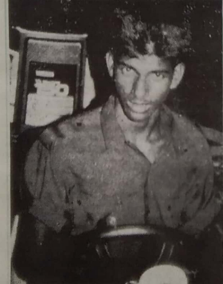
கொழுகத்த பட்டிக் கவரிச்சி மோடி வரதன்