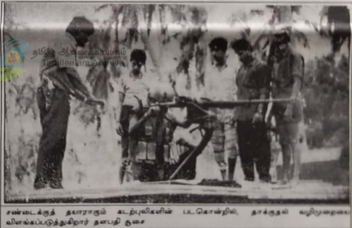
சண்டக்குத் தயாராகும் கடற்புலிகளின் படகொன்றில், தாக்குதல் வழிமுறைமையினைக்கொடுத்துக்கொள்ளும் தளபதி துரை...

சீங்களக் கடற்படையைப் பொறுத்தவரையில், ஆழ்க்கடலிலும் புலிகள் ஆதிக்கம் பெற்றுவிட்டது.