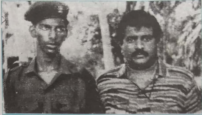
தலைவர் அவர்களுடன் கடற்கரும்புகள் மீட்டர் வரதன்

சோகத்தோடு அனைத்து நிற்கும் தலைவாளுக்குமில், பூரிப்