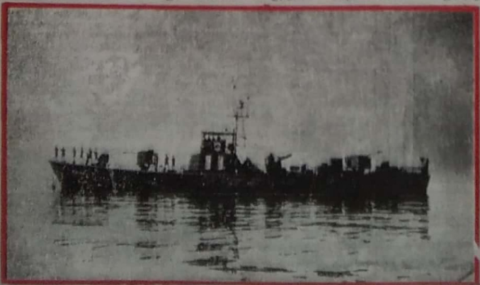
சிறீலங்கா கடற்படையிலுள்ள 'சங்கப் - 2' வகையைச் சேர்ந்த ஒரு மோட்டர் பிரம்மிப் படகு.

இந்த வகைக் கப்பல்கள் கடற்படையில் இரண்டு 'சங்கப் வகை - 2' இல் இந்து படகுகளும், 'சங்கப் வகை - 3' இல் நான்கு படகுகளும் உள்ளன.