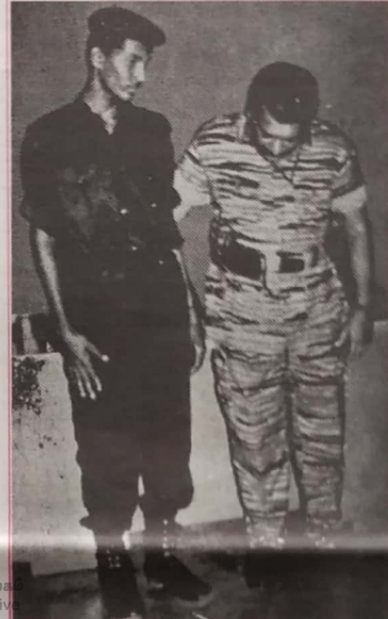
தலைவரோடு புவித்திரன் சோகம் பரவிய முகத்தோடு, உன்னைக் கைதொட்டுத் தடவி, "எந்தக் காரணமையுடைய வெடி பிடிச்சது...?" என்று, அக்கையையோடு தலைவர் விசாரித்தபோது, மெய்சிரித்து நின்று

"இயக்கத்திற்குப் போனது, விலத்திக் கொண்டு வாழலுக்கில்லை. தான் போனது தான்"