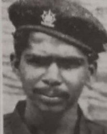
கடற்கரும்புகள் மீட்டர் மதன்

எப்போதும், சதிலும் கவலைப் பாத ஒருவனைப் போல பரி, சொல்லித் திரிந்து மதன், தனது திறமையை வெளிக்காட்டி போடு செயலில் காட்டுவான்.