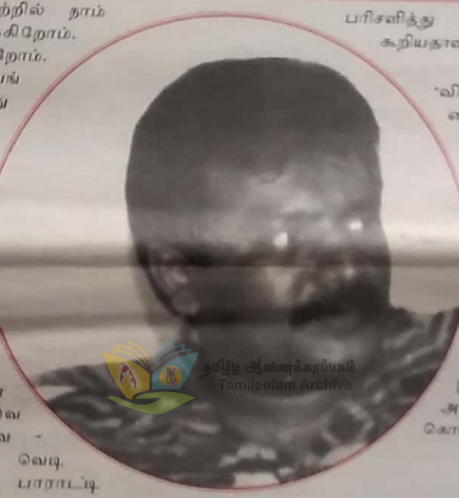
தமிழ் இளங்குமரன் TamilEelam Archive

எமது ஆயுதப் போராட்ட வரலாற்றில் நாம் மகத்தான சாதனைகளைப் புரிந்திருக்கிறோம். மரபெரும் வெற்றிகளை ஈட்டியிருக்கிறோம். உலகமே வியக்கும் வகையில் வீரகாவியங்களைப் படைத்திருக்கிறோம். எமது போராடிகளின் அபாரமான துணிவும் விடாமுயற்சியும் தளராத உறுதியும் இத்த வெற்றிகளுக்கு காரணமாக இருந்திருக்கின்றன. எதற்கும் துணிந்தால், விடாமுயற்சியை எடுத்தால், உறுதியோடு இயங்கினால் எந்தச் சாதனையையும் சாதித்து விடலாம். எமது இயக்கத்தின் இராணுவ வெற்றிகள் இந்த உண்மையையே எடுத்துக்காட்டுகின்றன.