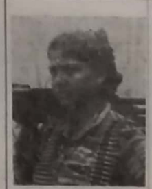
கயின் சந்தியா (போகேல்வரி நேரிப்பகம்) கொட்டகாடு, ஏறமலன் மேற்கு, ஏடுபெட்டி.

பெரிய உணர்வை திரைப்படம் திரைப்படம் போலவே கூடாது நின்று. ஆணையினம் உயர்மேலே சந்தியா போட்டி, மலர், கணமலன், இணைப்புகள் மூலம் துயர் மக்கள் எம்மம் நட்டிடுகின்ற காலம். தீர்த்தநாம் இடும் வழங்கக் கூடாது. எழுது திட்டமிடக்கூடிய உறுதியாக நிக் வேண்டும்."